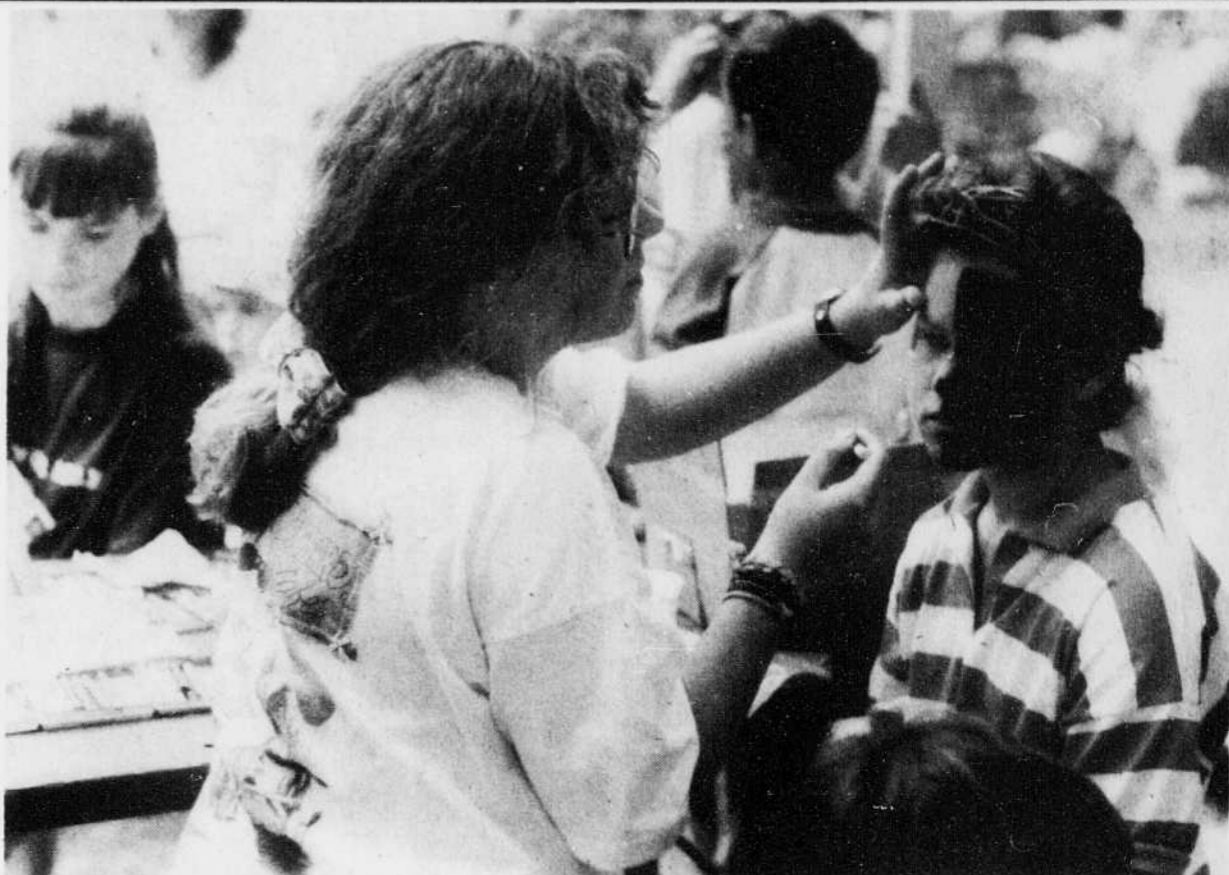
Le Festival mondial de folklore de Drummondville, ce n'est pas uniquement le rendez-vous de la danse et des chants. C'est aussi la fête des enfants qui aiment bien se faire «barbouiller» le visage pour ajouter de la couleur à l'événement.

Aujourd'hui, le festival entreprend son dernier week-end. On dit que les salles sont encore complètes pour les derniers spectacles et il faut aussi s'attendre à une foule record pour les cérémonies de fermeture dimanche au Centre Marcel-Dionne.