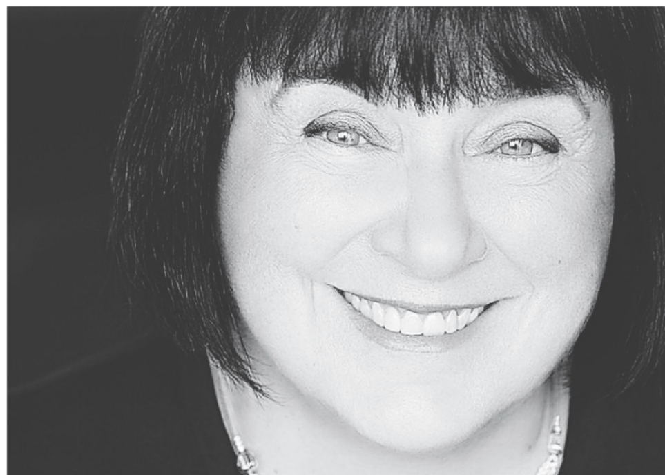
La présidente-directrice générale de Télé-Québec, Michèle Fortin, vient de lancer un projet ambitieux appelé La Fabrique culturelle, une plateforme Web dédiée à la culture sous toutes ses formes.

https://numerique.banq.qc.ca/patrimoine/details/52327/3539223