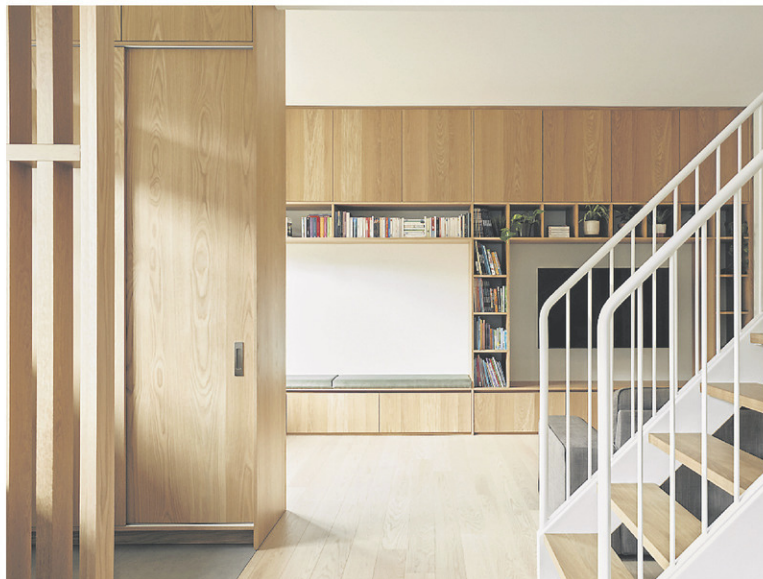
Atelier Filz a misé sur l'optimisation de l'espace dans l'un de ses projets résidentiels dans le quartier Limoilou. —TO MARIE HRAINVILLE

«On a besoin de chaleur, on a besoin de se sentir bien. On est