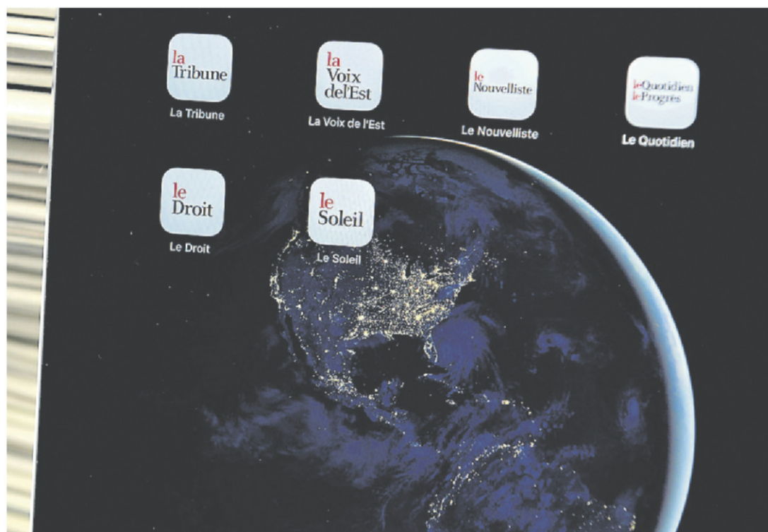
ERICK LABBÉ, ARCHIVES LE SOLEIL

Bibliothèque et Archives nationales du Québec https://numerique.banq.qc.ca/patrimoine/details/52327/4492602