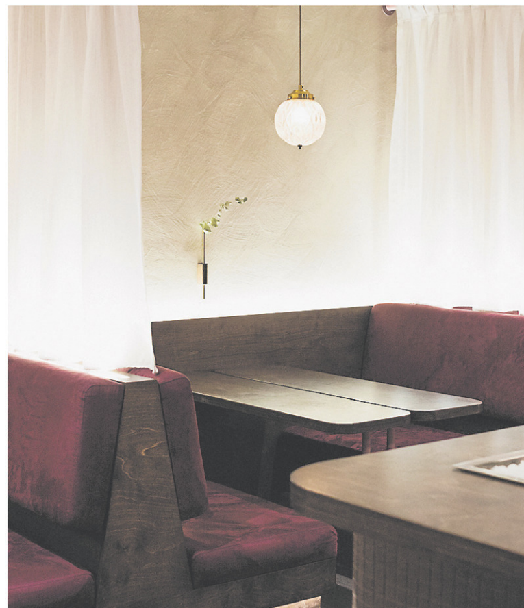
Pour le design intérieur du Bar Jacques, Atelier Filz a utilisé un fini à la chaux pour un effet enveloppant.

Ce n'est pas du recyclage en soi, précise-t-elle. Il s'agit plutôt de