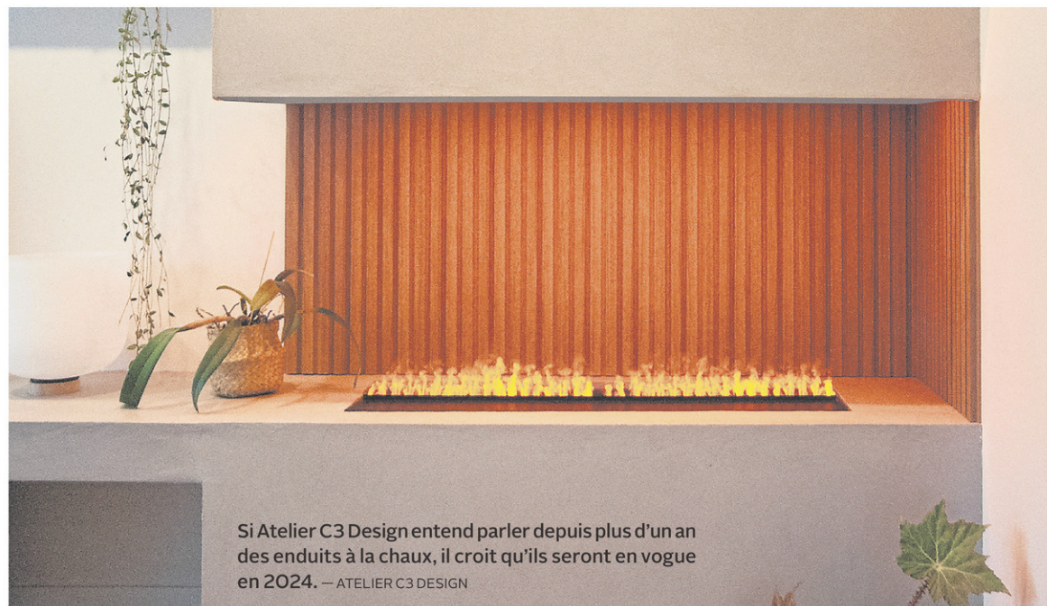
Si Atelier C3 Design entend parler depuis plus d'un an des enduits à la chaux, il croit qu'ils seront en vogue en 2024. —ATELIER C3 DESIGN