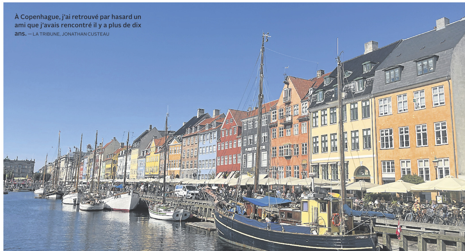
À Copenhague, j'ai retrouvé par hasard un ami que j'avais rencontré il y a plus de dix ans.

Le Bourlingueur sera de retour en 2024 en version numérique. À lire dans la section Vivre de notre site Web.