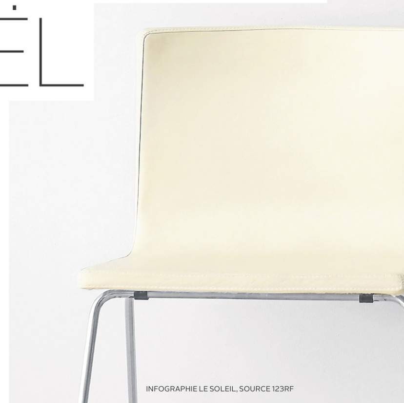
INFOGRAPHIE LE SOLEIL

intéressante. On aimerait beaucoup explorer ça davantage pour offrir ce service aux communautés. Ce serait une belle contribution pour intégrer les gens qui débarquent au Québec. Ils trouvent souvent fascinant ce rituel d'intégration sociale d'amener les enfants rencontrer le père Noël, car cette tradition n'existe pas partout.» FRANCIS HIGGINS