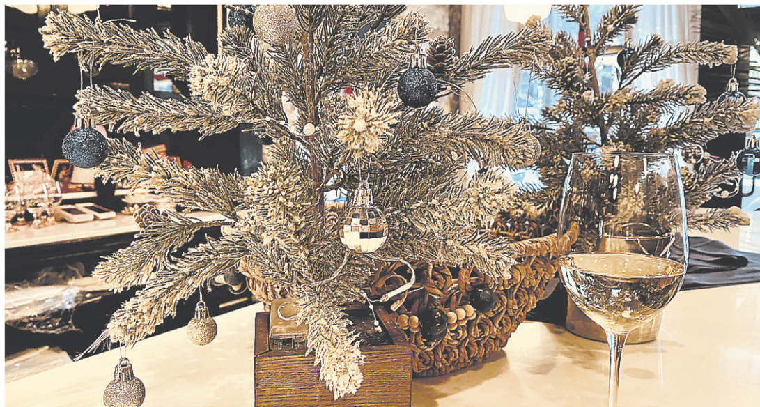
Que la magie de Noël illumine vos moments festifs d'une abondance d'amour et de joie. — NATALIE RICHARD

Il est rare de trouver un vin d'une telle qualité pour un prix aussi doux. L'assemblage est majoritairement macabeo, un cépage espagnol aromatique qu'on appelle aussi viura.