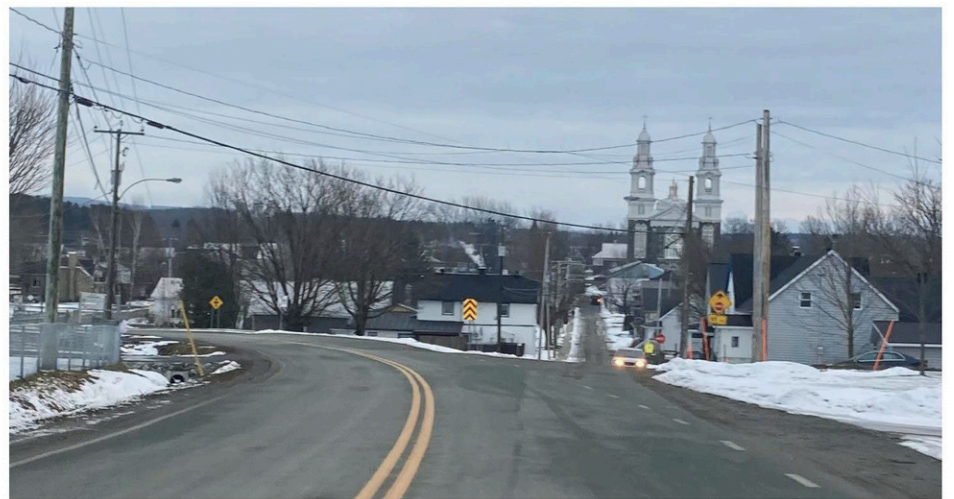
Une hausse de taxes était aussi inévitable à Sainte-Hénédine.

« Le Développement Chabot est important, car c'est là que sera construit le nouveau CPE, alors tout ça doit se faire rapidement. La piste