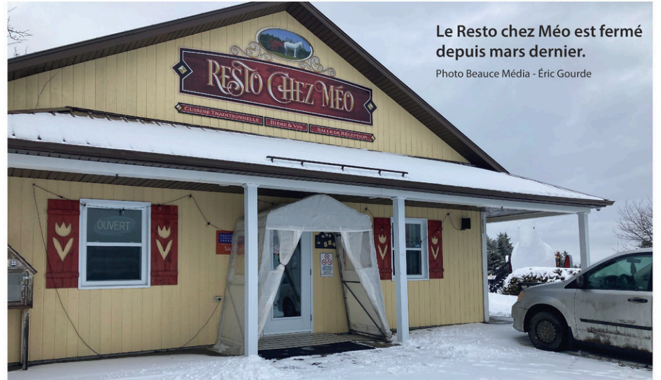
Le Resto chez Méo est fermé depuis mars dernier.