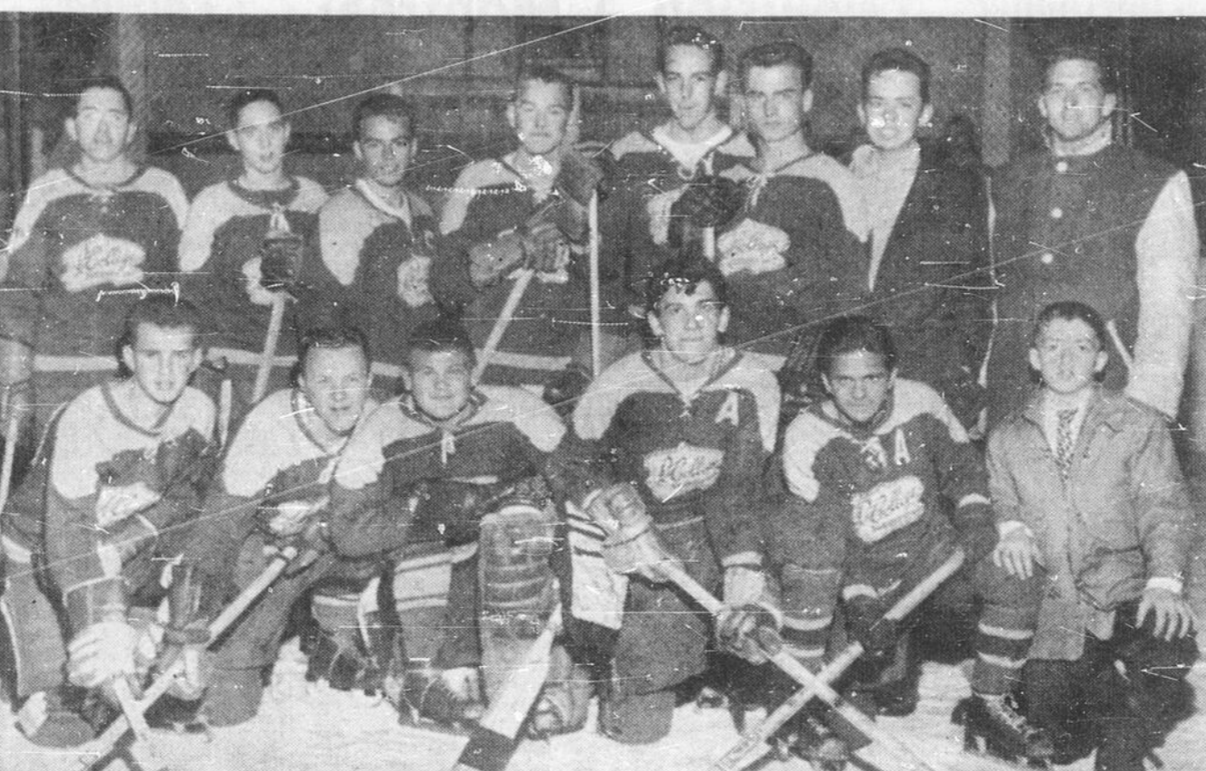
L'EQUIPE JUVENILE DE HOCKEY DU COLLEGE DU SACRE-COEUR recevait dimanche dernier la visite d'une équipe d'étoiles de la ligue juvénile du Temiscamingue...