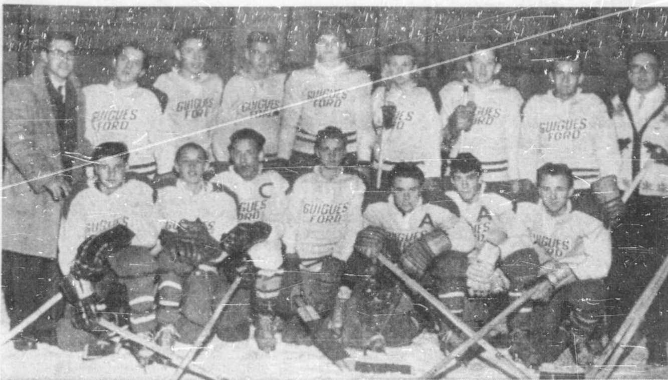
L'EQUIPE DE HOCKEY DE GUIGUES a joué une partie récemment contre l'équipe juvénile de hockey du collège du Sacré-Coeur de Sudbury...