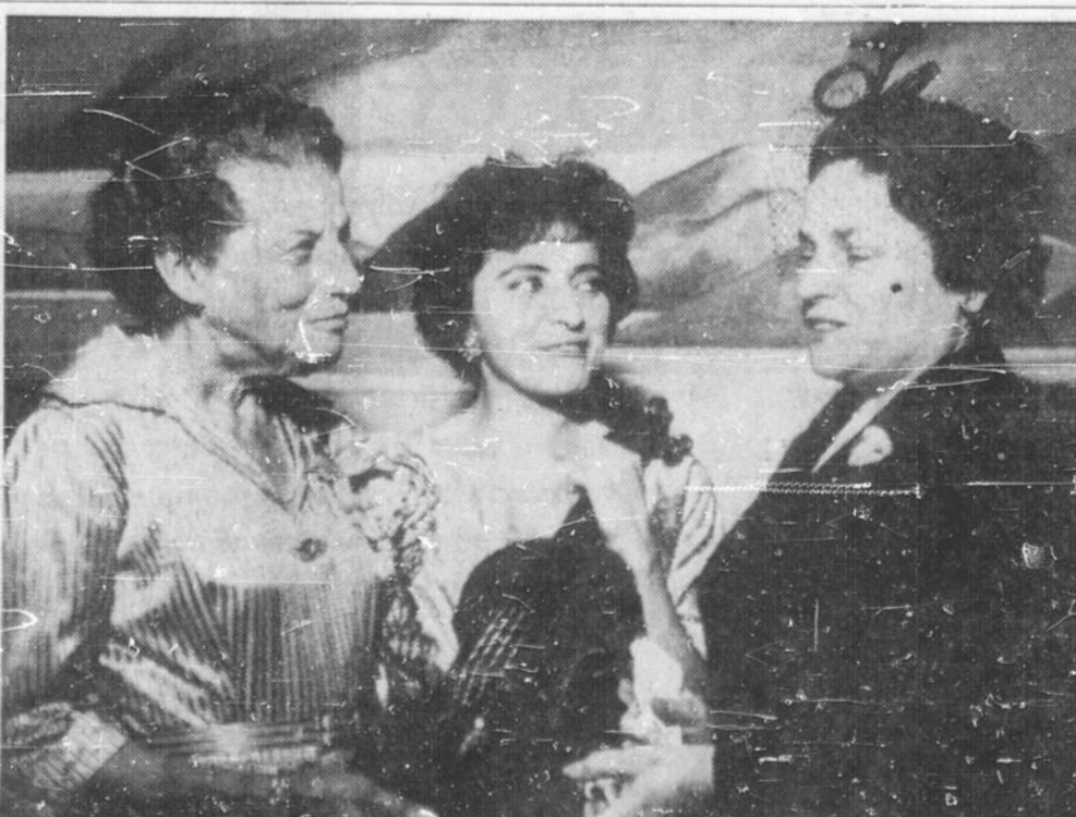
ANNEE DU REFUGIE — Au cours du thé offert mardi soir à la salle de l'église presbytérienne Knox, par le comité hongrois de ce groupement d'Ottawa créé à l'occasion de l'Année mondiale du réfugié, on remarque de

La maison funéraire Ethier Ltee a la direction des funérailles. La date et l'endroit où la dépouille mortelle sera exposée seront annoncés plus tard.