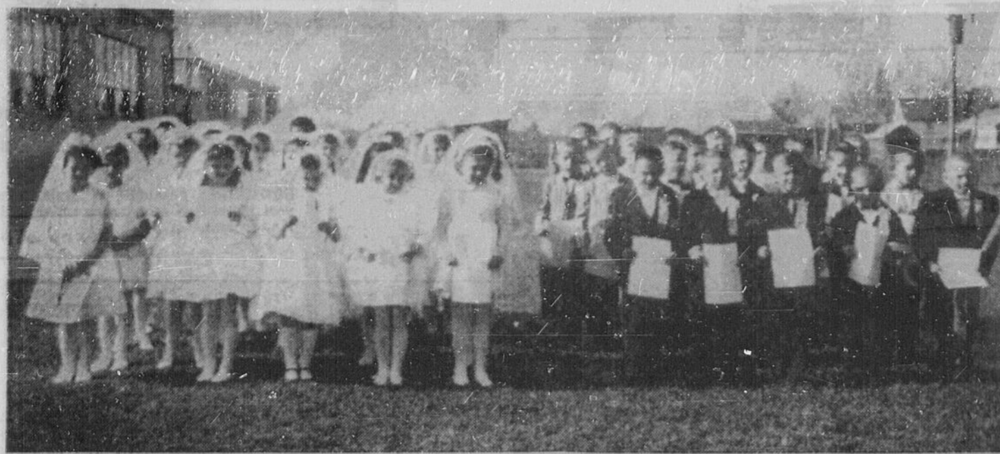
A STURGEON FALLS — Une belle cérémonie de première communion avait lieu récemment à la paroisse de la Résurrection, de Sturgeon Falls. On voit ici le groupe, comprenant