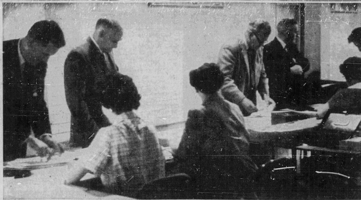
AU CONGRES DES MAIRES — On remarque le bureau d'enregistrement du congrès où plus de 600 délégués passeront durant la journée de dimanche. Des dames reçoivent les délégués et enregistrent leur nom, leur remettant les insignes et les souvenirs du congrès. On compte plus de 50 souvenirs remis à chaque délégué dans une boîte à leur arrivée à l'aréna de North Bay où se déroulent le congrès.