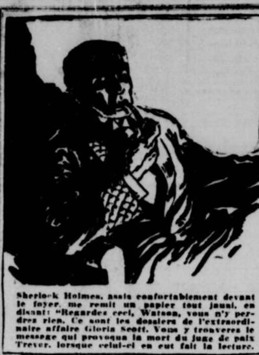
Sherlock Holmes, assis confortablement devant le foyer, me remit un papier tout jauni, en disant: "Regardez ceci, Watson, vous n'y perdrez rien. Ce sont les dossiers de l'extraordinaire affaire Gloria Scott. Vous y trouverez le message qui provoqua la mort du juge de paix Trever, lorsque celui-ci en fut fait le lecteur."