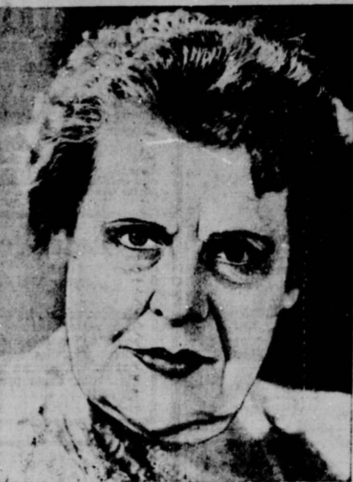
MARIE DRESSLER, la grande vedette que l'on verra dans la plus étonnante production de l'année, "Dinner at Eight", qui passera en première à Montréal au His Majesty's le 16 du courant. C'est un film de vedettes, et l'on n'en compte pas moins d'une douzaine. "Dinner at Eight" éclipsera "Grand Hotel".

réel, qui accepte la vice-présidence du comité d'honneur. "Vous pouvez être assurés, écrit-il, que vous aurez tout mon appui pour atteindre le but que s'est formé votre Ligue."