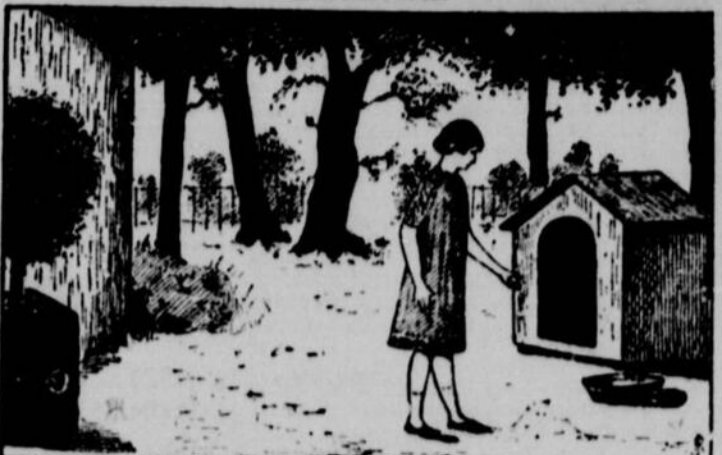
Louloute s'aperçoit que Diane et ses deux petits chiens ne sont plus dans la niche. Où les voyez-vous?