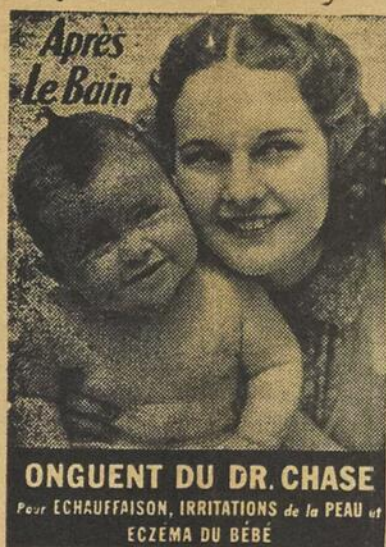
ONGUENT DU DR. CHASE Pour ECHAUFFAISON, IRRITATIONS de la PEAU et ECZEMA DU BÉBÉ

facilement et rapportent un meilleur prix. Il vient actuellement un trop grand nombre de sujets maigres et légers au cours à bestiaux; cela a pour effet de créer de l'encombrement et de faire baisser les prix. La semaine dernière, les meilleurs lots de moutons ont été les premiers à se vendre, et les moins bons, c'est-à-dire ceux qui contenaient le plus de sujets communs et légers, les plus difficiles à écouler. Il nous a même fallu attendre plusieurs jours avant de pouvoir en disposer. Donc, il ne sert à rien de nous consigner des agneaux légers; les représentants des salaisons ne veulent pas les acheter et ils ne rapportent guère plus que la moitié du prix des bons. Ceux qui persistent à en expédier contribuent largement à congestionner le marché, à faire baisser les prix et, de ce fait, rendent un mauvais service aux producteurs en général. Il est vrai cependant que s'il n'arrivait que des bons agneaux les cours fléchiraient quand même, mais la baisse serait moins accentuée. Une certaine dépréciation des cours est presque inévitable actuellement parce que le plafond du prix des carcasses a été diminué de 29 3-4¢ à 26 le 2 septembre dernier, ce qui représente tout près de 2c la livre