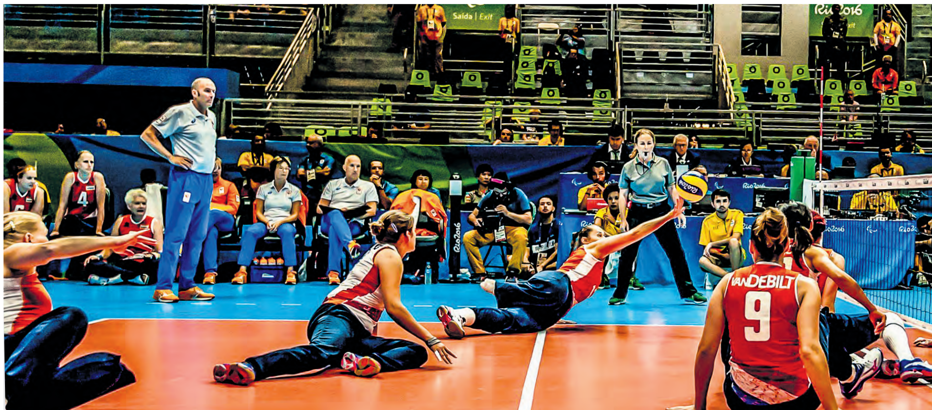
En pleine action lors des Jeux paralympiques de Rio.