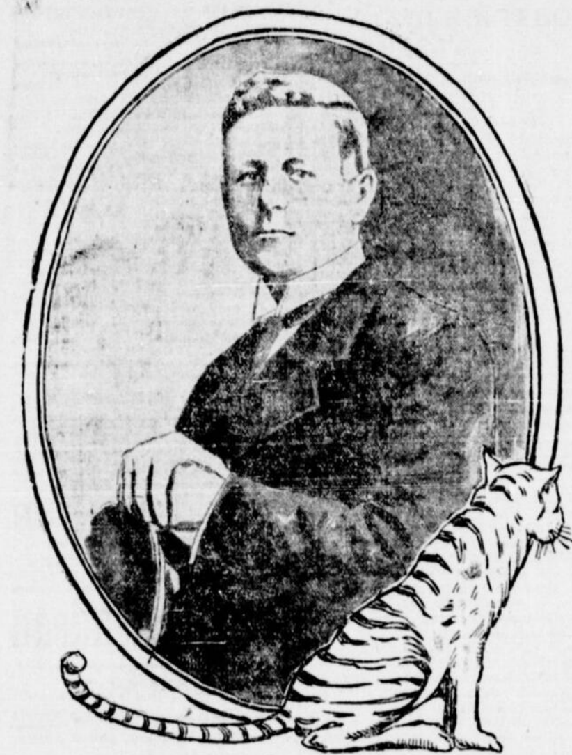
J. B. McCLELLAN, congressman, démocrate, le nouveau maire de New-York.

New-York, 4.—Geo. B. McClellan a été élu hier soir, troisième maire du "Greater New York" par une majorité d'environ 70.000 voix.