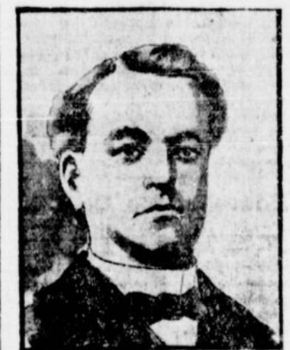
HON. JOHN L. BATES, gouverneur du Massachusetts.

M. Chas. F. Murphy, le chef du Tammany Hall, dit: