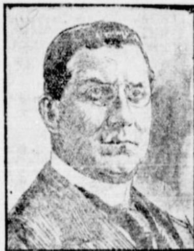
CHARLES F. MURPHY, leader de Tammany Hall.

"Le peuple a parlé. Nous sommes enchantés du résultat, car il est conforme à nos prévisions. Si l'élection avait eu lieu une semaine plus tard, Devery aurait probablement réuni plus de votes que Low."