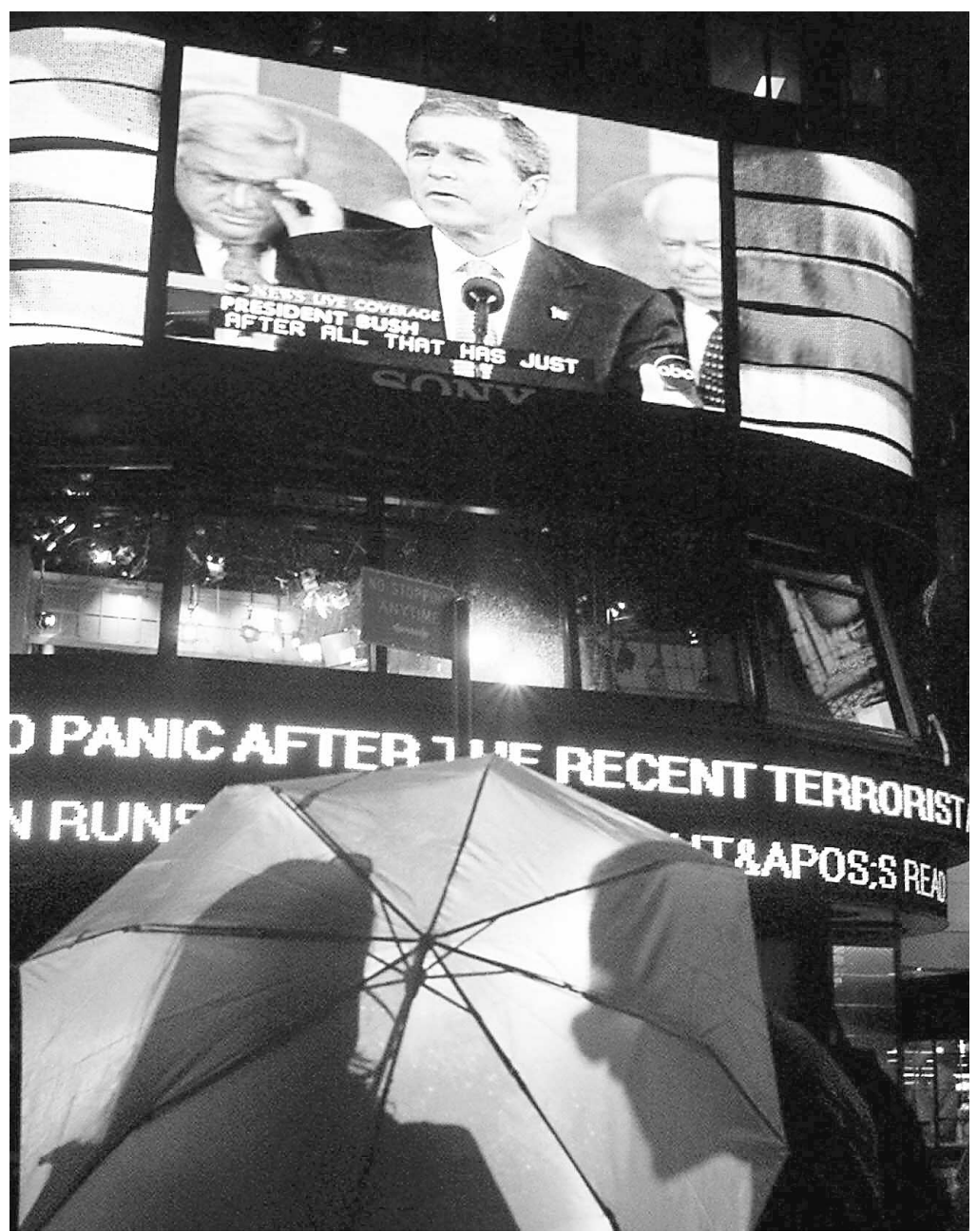
Le 20 septembre 2001, des écrans géants diffusaient à Times Square un discours du président George W. Bush devant le Congrès, relativement aux attentats terroristes survenus neuf jours plus tôt.

Tout de suite, une question surgit : ne pensez-vous pas que les émotions ressenties le 11 septembre et les jours qui ont suivi étaient bien réelles, qu'elles ont créé un grand mouvement de solidarité pour venir en aide aux victimes d'ici et d'ailleurs ? « Oui, je crois que ce que les gens ont ressenti était bien réel, mais je crois aussi que c'était unique dans l'histoire,