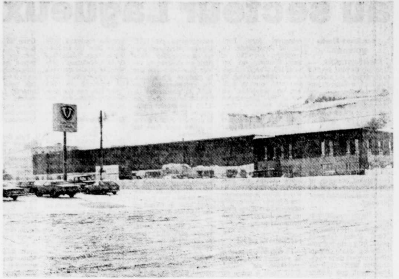
L'abattoir Turcotte & Turmel, à Vallée-Jonction, est l'un des deux établissements de la région à fermer temporairement ses portes aujourd'hui, à moins d'une entente de dernière minute.

Dans le but de mettre fin à cette paralysie dans l'industrie du porc, LE SOLEIL a été informé, "qu'une rencontre est prévue pour bientôt entre le ministre Jean Garon, les représentants de la Coopérative fédérée de Québec, et ceux de la Fédération des producteurs de porcs du Québec".