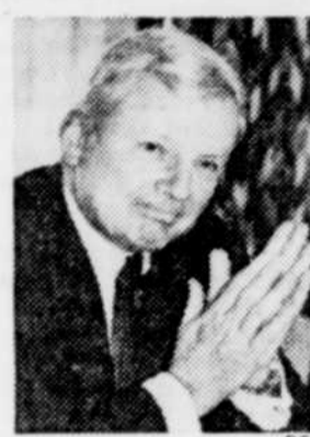
Le président du conseil d'administration de la Banque de Montréal, M. William D. Mulholland.

En ce qui concerne les taux hypothécaires, l'institution prêteuse ne prévoit pas qu'ils baisseront en deçà de 17 pour 100 cette année et ils pourraient même atteindre les 20 pour 100. Le taux préférentiel de la banque centrale oscillera entre 15,5 et 16,5 pour 100 jusqu'à l'été pour remonter à 17 où