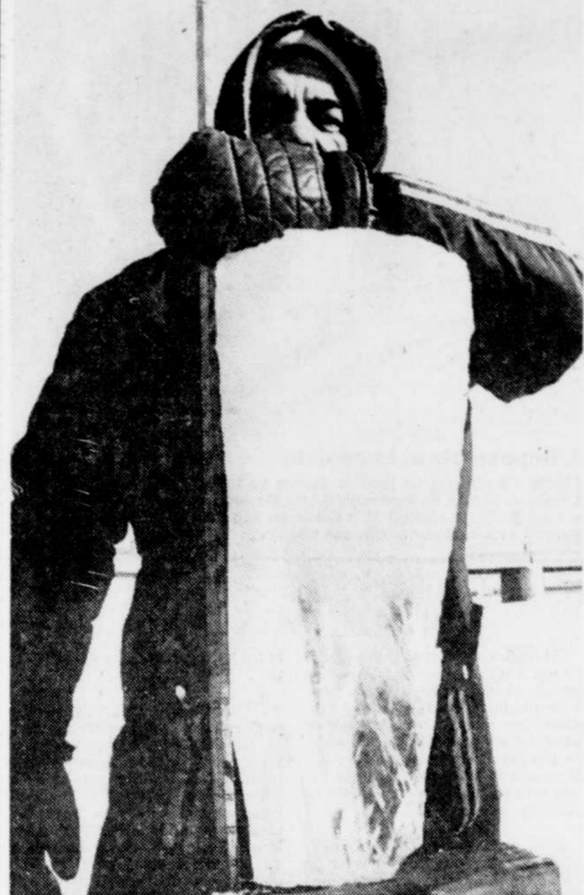
Le Soleil, André Pichette