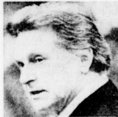
M. Jacques Parizeau et ses collègues provinciaux rencontrent ce matin M. Allan MacEachen.

Le premier ministre René Lévesque a affirmé hier que la politique salariale de son gouvernement à l'égard de ses employés dépendra en grande partie de ces arrangements fiscaux. Tant que ces "incertitudes" ne seront pas levées, a-t-il dit, nous ne pouvons pas fermer notre budget. De