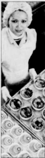
L'industrie agroalimentaire a du travail à offrir.

LE SOLEIL ABONNEZ-VOUS 686-3344 1 866 686-3344