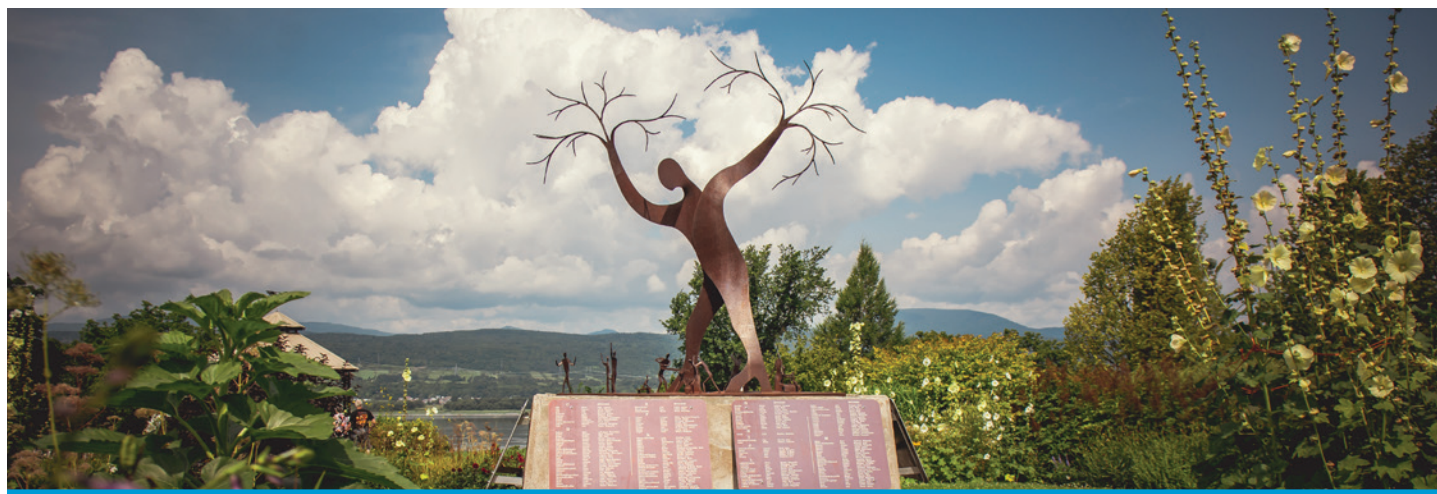
D'ailleurs, le nom de chacun de ces maris et de ces femmes, qui ont implanté leurs racines ici, est inscrit sur le mémorial des Familles Souches du Parc-des-Ancêtres de l'île d'Orléans.

Pour en savoir plus sur l'histoire de ces familles qui se sont établies à l'île d'Orléans, visitez la Maison de nos Aïeux, centre d'histoire et de généalogie de l'île d'Orléans.