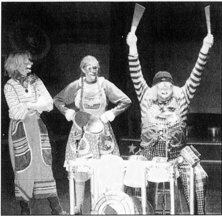
Souvent simples mais bien orchestrés, les numéros des personnages à la bouille sympathique savaient décrocher le sourire des tout-petits: difficile de résister aux clowns renifleurs de pied, aux clowns entartés ou encore aux bouffons gaffeurs!

Canyny n'a pas hésité à demander l'aide d'un petit garçon et ce dernier