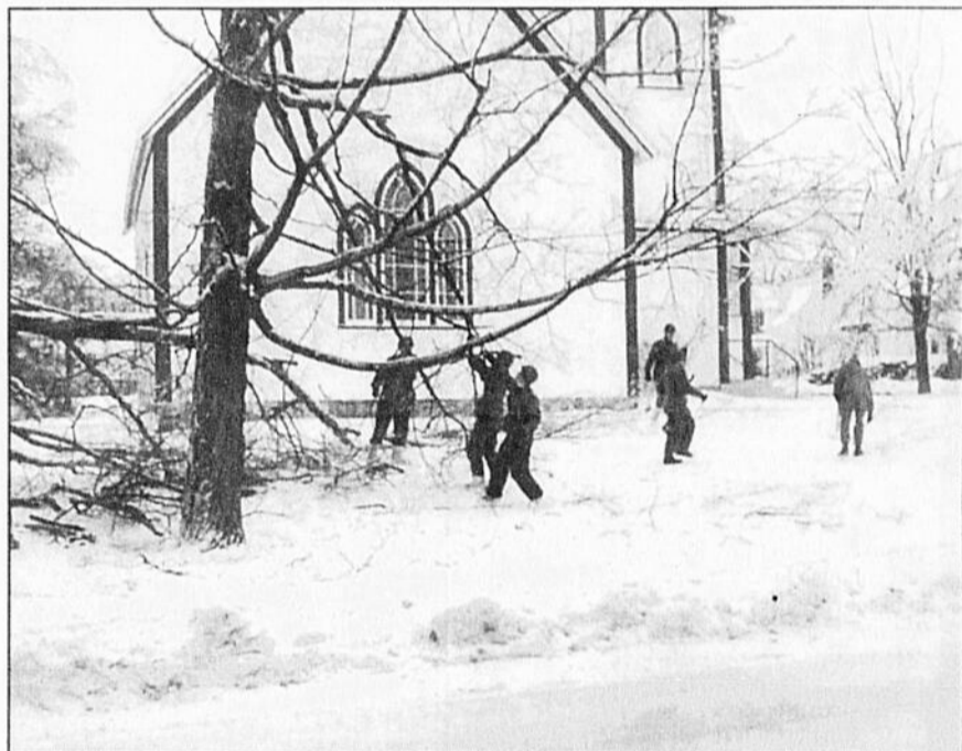
Le 9 janvier 1998, le village de Danville subit des torts irréparables.

7 février - Rétablissement complet du service d'Hydro-Québec.