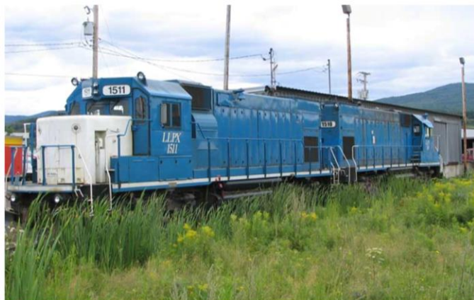
Les éternels sœurs 1511 et 1510