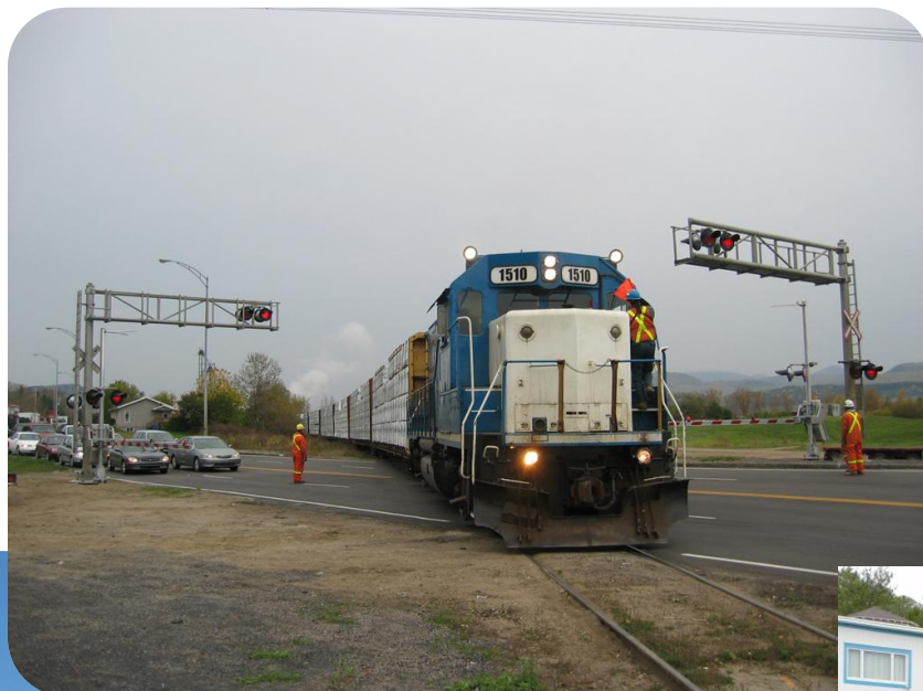
Photo prise sur la subdivision Murray Bay à l'intersection de la route 138 à Clermont, au PM 90 lors du test de la compagnie X-Rail venant juste d'installer les signaux lumineux avec des diodes électroluminescentes et de nouvelles barrières, le 14 octobre 2005.