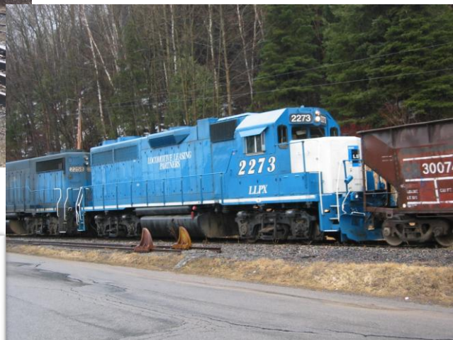
La 2258 avec la 2273