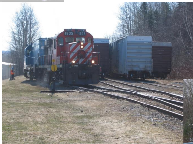
La RS18u 1835