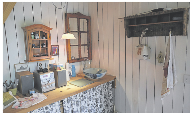
■ La résidante de West-Brome a aménagé son atelier à son image, pour s'y sentir parfaitement bien.