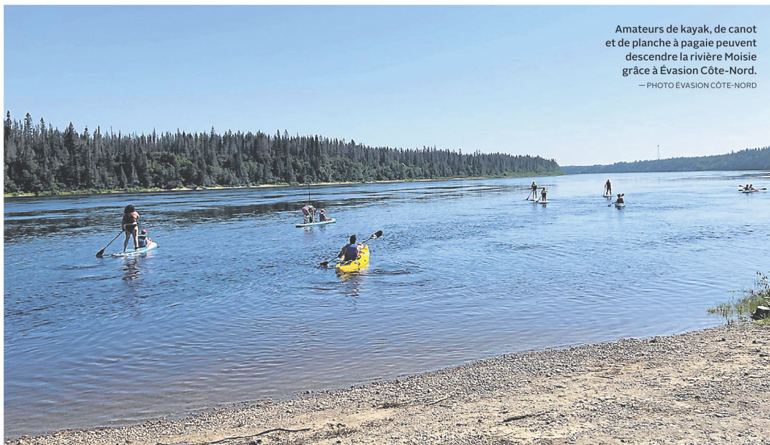
Amateurs de kayak, de canot et de planche à pagaie peuvent descendre la rivière Moisie grâce à Évasion Côte-Nord.