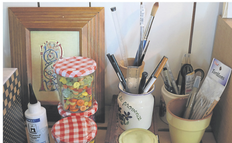
■ Tout est à sa portée pour dessiner, coudre ou broder.