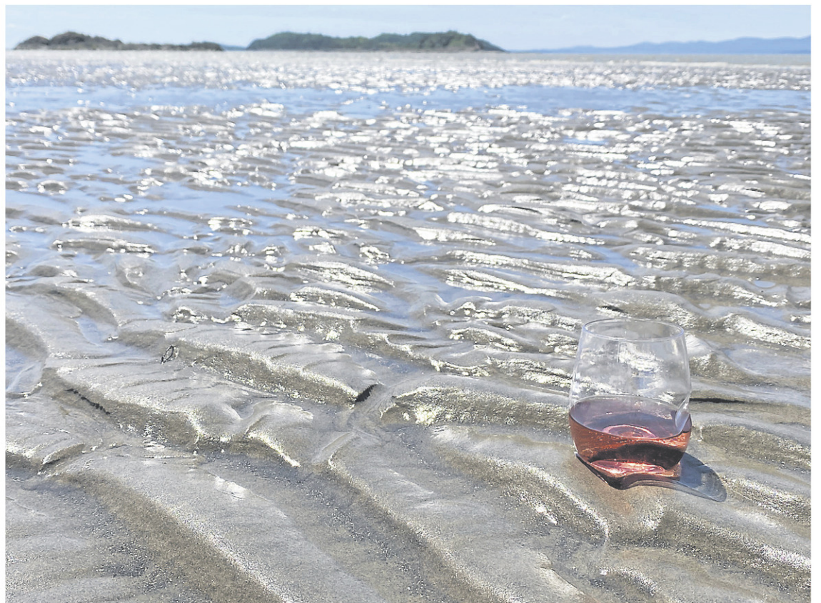
Vins emblématiques du beau temps et des vacances, je dis que les rosés existent pour nous donner du bonheur et nous gâter de fraîcheur.

Pour en savoir davantage, suivez-moi sur www.sommeliereaventuriere.com