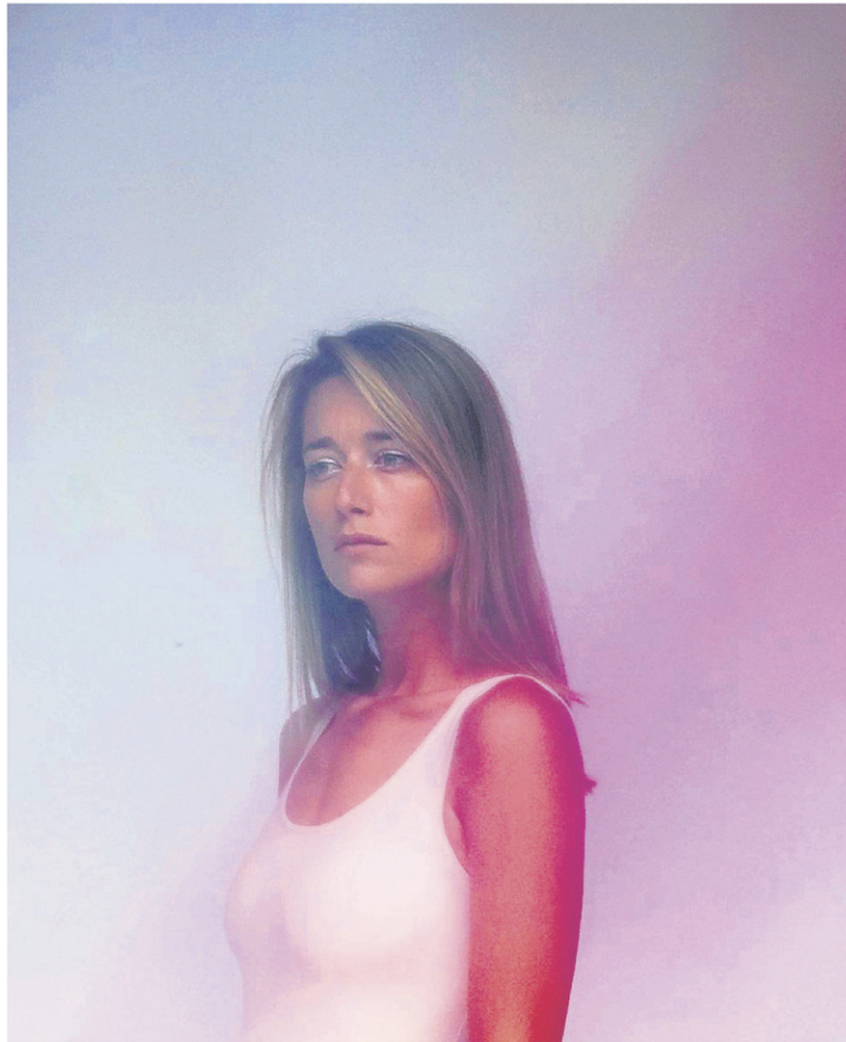
La comédienne explore la peinture depuis son enfance. — FOURNIE

Le plus récent fruit de son imaginaire est une série d'œuvres