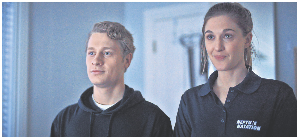
Antoine Olivier Pilon et Mylène Mackay incarnent un nageur de haut niveau et son entraîneuse dévouée, deux êtres complexes et en quête de sens.

Cote : ★★★★★ Genre : Drame historique Réalisateur : David Lowery Acteurs : Dev Patel, Alicia Vikander, Joel Edgerton Durée : 1h41