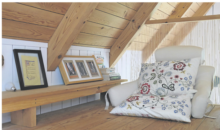
■ Un petit escalier de bois mène à cette mezzanine où on peut dormir et rêvasser. La hauteur du toit permet de s'y tenir debout.

Le texte a été édité pour faciliter la lecture.