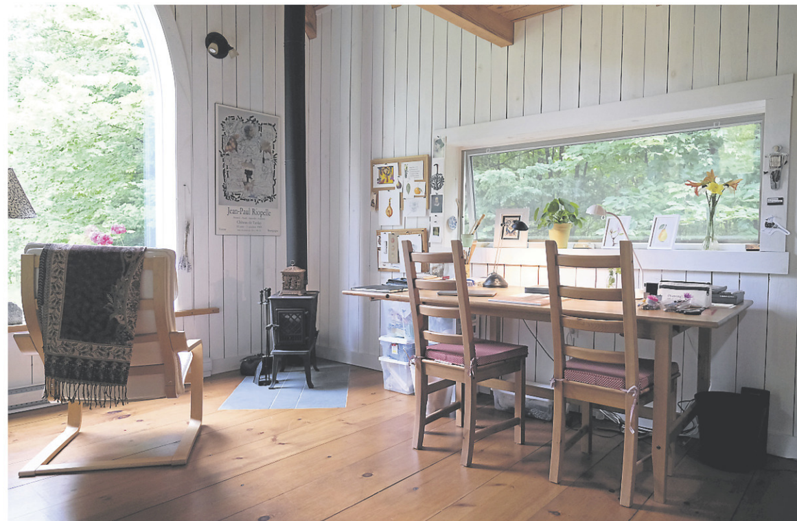
■ Avec son petit poêle à bois, l'endroit est douillet, été comme hiver. L'artiste s'y installe régulièrement pour lire devant la grande fenêtre.

«J'avais toujours rêvé d'avoir un atelier. Je suis une touche-à-tout et je voulais un lieu bien à moi où je pouvais m'installer et me désinstaller à ma guise. Ici, on avait la possibilité de construire un bâtiment secondaire sur le terrain. L'idée a alors émergé. Puis un jour, une tante très chère, qui était religieuse, m'a légué un montant à son décès. C'est cet héritage qui a servi à