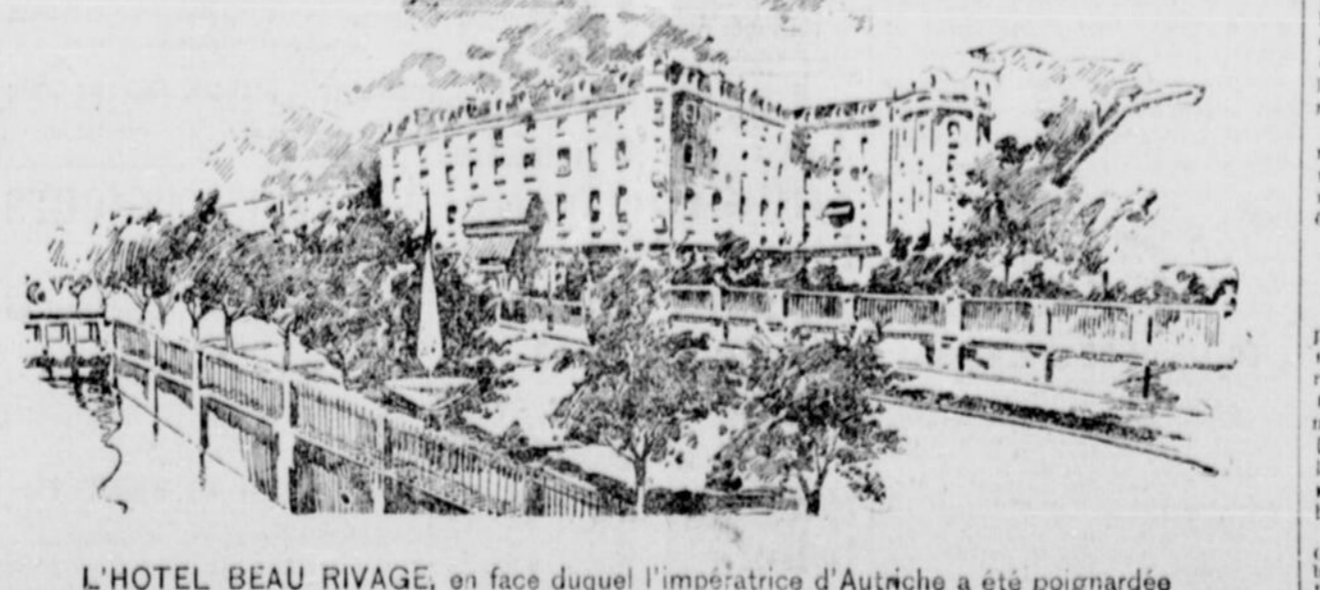
L'HOTEL BEAU RIVAGE, en face duquel l'impératrice d'Autriche a été poignardée