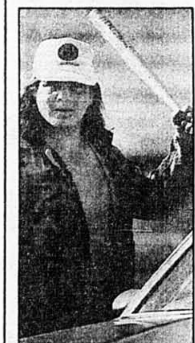
Un guerrier mohawk brandit un bâton de baseball dans la réserve Akwesasne, près d'Hogansburg (N.-Y.). Les adversaires et les partisans du casino en sont venus aux coups hier matin.