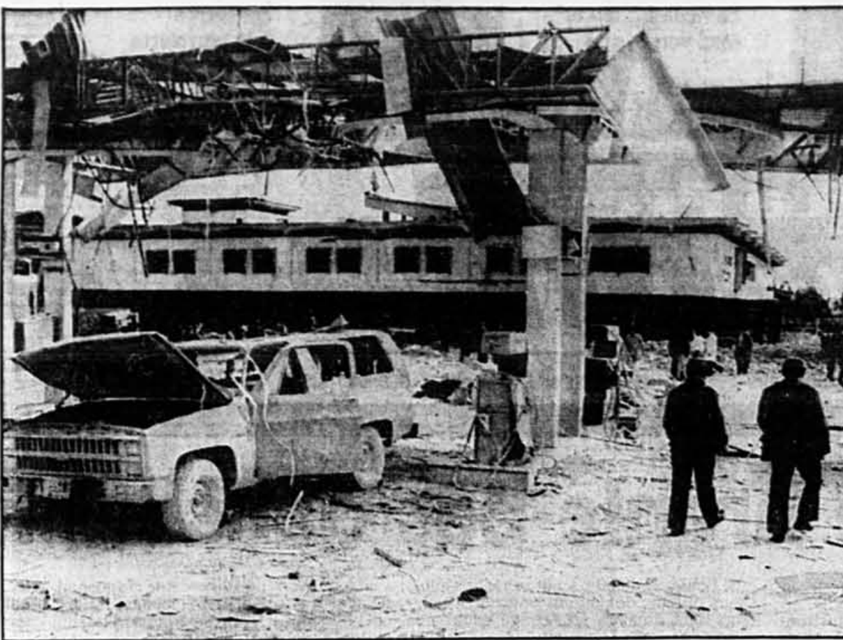
Un véritable spectacle de désolation régnait à l'extérieur du bâtiment qu'occupe le journal colombien El Espectador , après l'attentat hier attribué aux trafiquants de drogue.

Un véritable spectacle de désolation régnait au siège de El Espectador , un bâtiment moderne en brique rouge, situé à l'ouest de la capitale colombienne. Toutes les vitres de l'immeuble ont été soufflées et la salle de rédaction