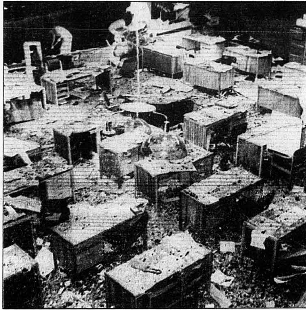
Deux ouvriers nettoient l'intérieur de la salle de rédaction du journal colombien El Espectador, qui a été hier la cible d'un attentat à la bombe à Bogota.

L'explosion a soufflé la station VOIR BARONS EN A 2