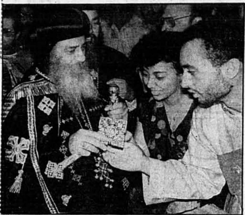
Le pape Shenouda III, chef de l'Église copte orthodoxe effectue présentement une visite de quatre jours à Montréal. Il est ici entouré de fidèles.