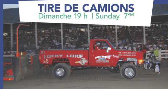
TIRE DE CAMIONS Dimanche 19 h | Sunday 7 PM

No beer bottles or cans allowed on the grounds. Beer may be purchased in the recreation center.