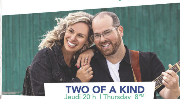
TWO OF A KIND Jeudi 20 h | Thursday 8 PM