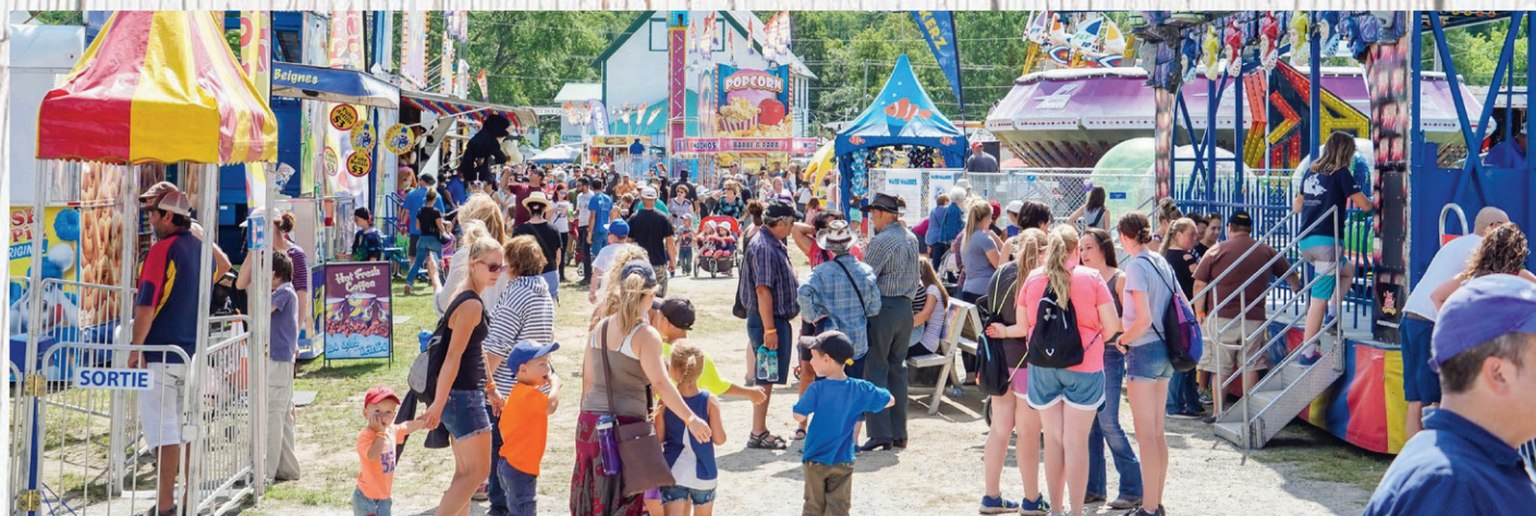
L'Expo d'Ayer's Cliff aura lieu du 24 au 27 août prochain.

Parmi les attractions les plus populaires, notons les courses sous harnais. « Ça attire un très vaste public puisqu'on est le seul rassemblement où il est possible d'en voir. On est