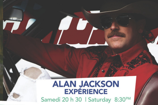
ALAN JACKSON EXPÉRIENCE Samedi 20 h 30 | Saturday 8:30 PM

La barrière ouvre à 12 h jeudi le 24 août