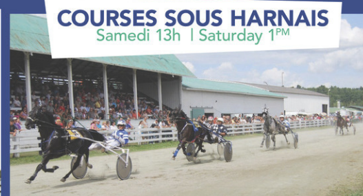
COURSES SOUS HARNAIS Samedi 13h | Saturday 1 PM