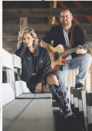
Duo Two of a kind

AYER'S CLIFF. L'Expo d'Ayer's Cliff, c'est bien sûr les jugements d'animaux, les différentes courses et les incroyables manèges du site. Mais, c'est aussi des spectacles endiablés qui feront chanter et danser les festivaliers. Voici trois rendez-vous musicaux à inscrire à l'agenda!