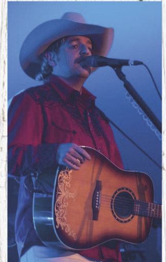
Alan Jackson Experience

Mise en scène grâce à l'expérience country de musiciens chevronnés, le spectacle hommage Alan Jackson Experience présente les succès les plus mémorables de cette grande star de la musique. Avec pas moins de sept instrumentalistes et des arrangements vocaux à couper le souffle, le public tombera rapidement sous le charme des artistes présents sur scène. De 1989 à aujourd'hui, ce spectacle retrace quelques-uns des moments marquants de la vie d'Alan Jackson. L'amour, la vie et les voitures demeurent au cœur des thèmes privilégiés dans les textes de Jackson.