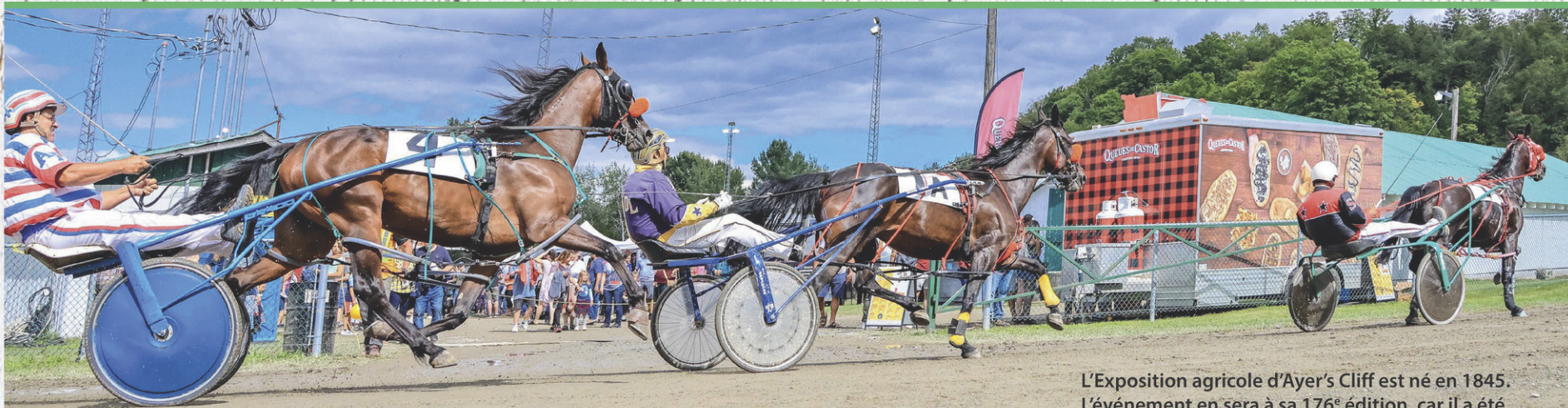
L'Exposition agricole d'Ayer's Cliff est né en 1845. L'événement en sera à sa 176 e édition, car il a été interrompu par la pandémie.