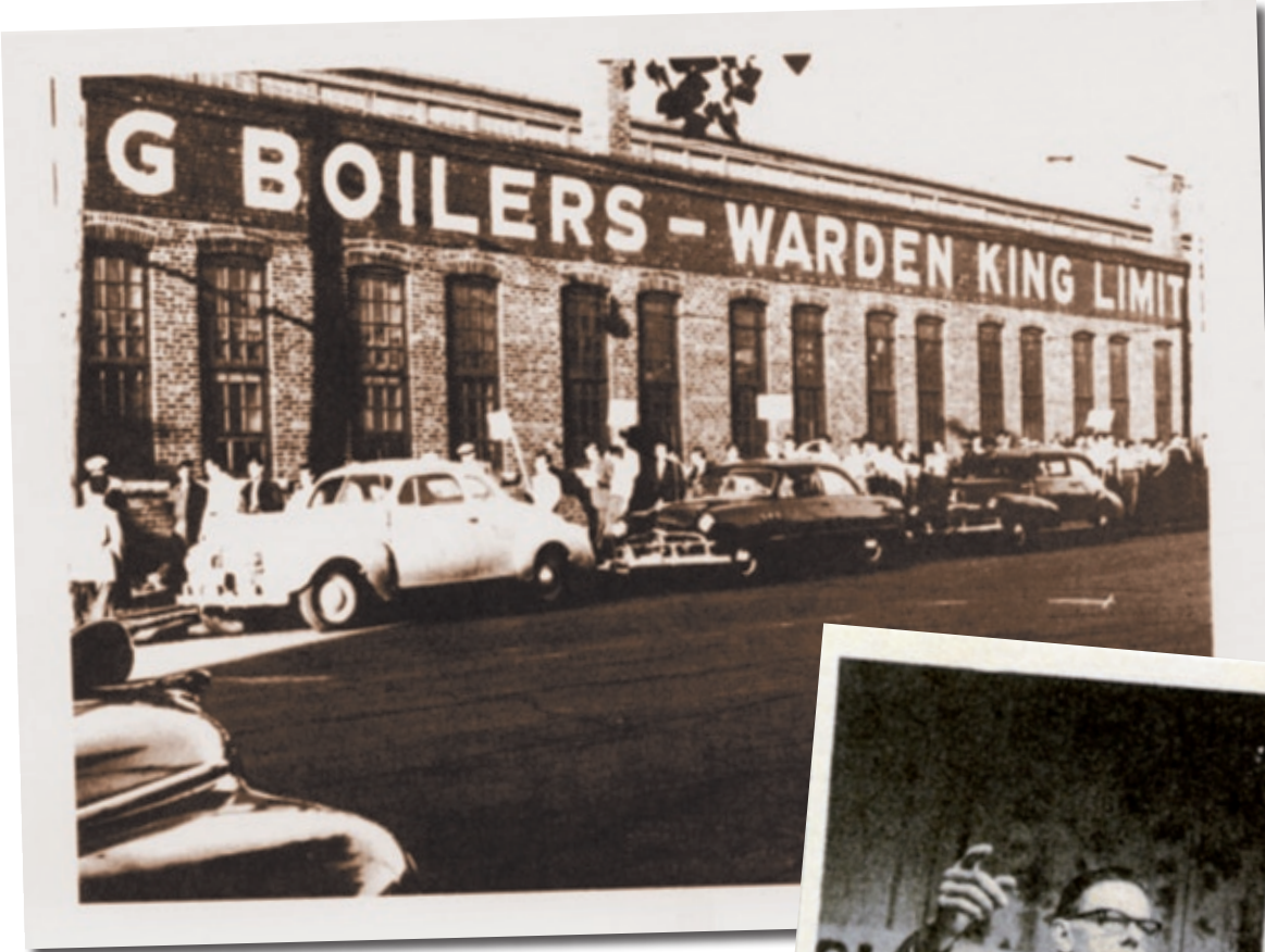
La Warden King, filiale de Crane, dans les années '50. Elle cessera ses activités en 1964.

On demande la réinstallation de sept anciens mili-