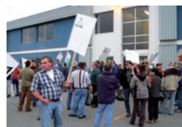
Devant les bureaux du ministère des Ressources naturelles et de la Faune à Rouyn-Noranda.

ber la crise, notamment au chapitre de l'aide aux travailleurs âgés. Il a ajouté que ces efforts demeureront toutefois insuffisants tant et aussi longtemps qu'Ottawa ne fera pas sa part.