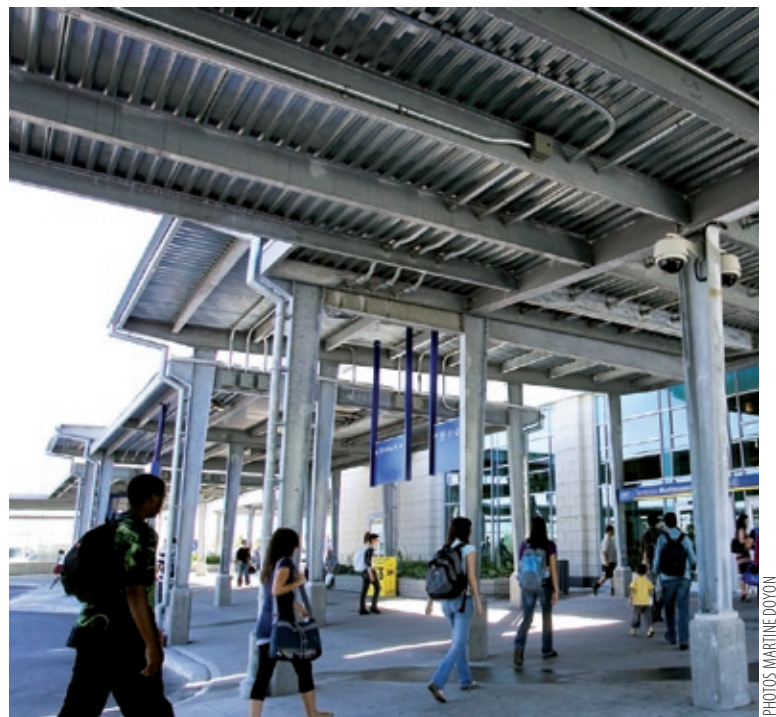
Les marquises de la nouvelle station de métro Montmorency, à Laval. Quinze serruriers en bâtiment ont travaillé plus de deux ans sur le chantier pour réaliser ce gigantesque projet.