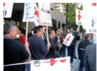
Devant les bureaux du ministère des Ressources naturelles et de la Faune à Gatineau.

Le 20 septembre dernier, la FTQ a donné son appui aux manifestations tenues par des centaines de travailleurs de l'industrie forestière dans toutes les régions du Québec.