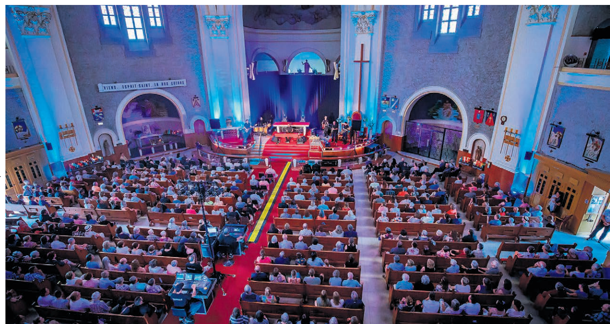
Gregory Charles a fait étalage de son vaste répertoire dans une cathédrale remplie à pleine capacité.

Bref, objectif atteint pour Gregory Charles, celui d'avoir fait du bien à plus de 1 000 personnes qui, il faut le dire, avaient déjà le cœur à la fête.