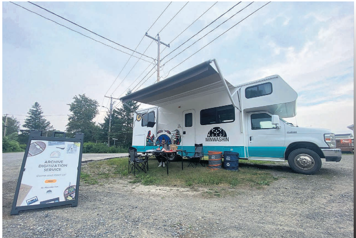
Ce VR, transformé en studio de numérisation itinérant pour recueillir sur place différentes archives des communautés anicinabe de la région, fait partie des récentes activités de Minwashin.

« Je suis fier que le gouvernement du Québec soutienne ces organismes dans leur mission de favoriser la participation à la culture, partout au Québec. Cela fait chaud au cœur de voir que par l'art thérapie et la médiation culturelle, notamment, leurs actions sur le terrain font la différence dans leurs communautés respectives », a poursuivi le ministre.