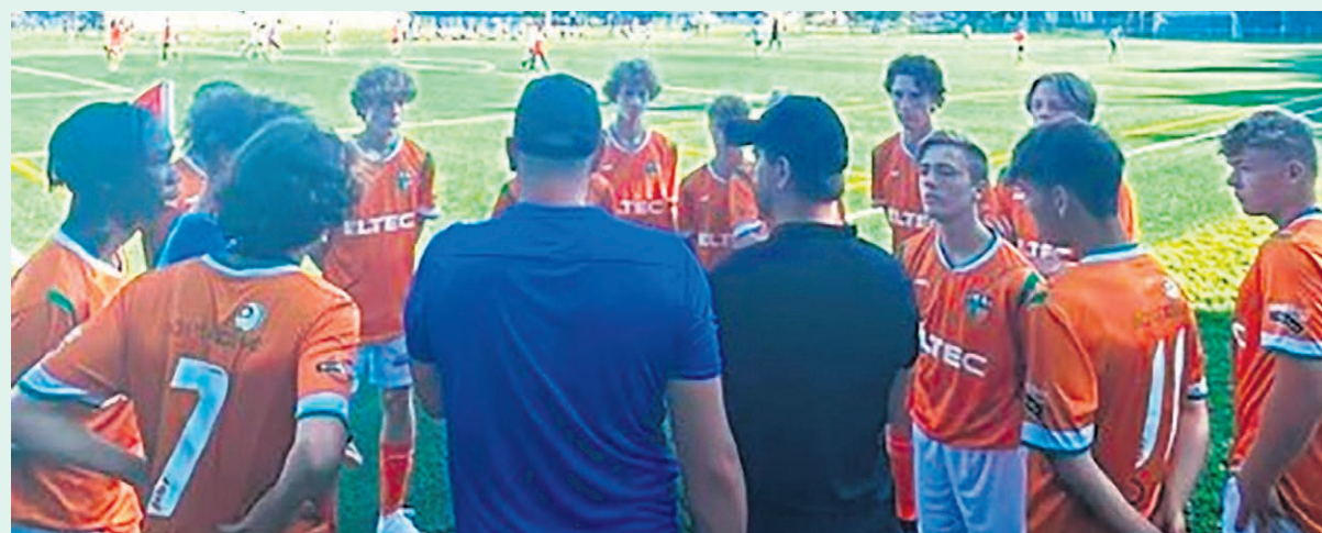
La première édition du Blizz'or U16 AAA a vécu l'expérience totale lors de la dernière Coupe du Québec