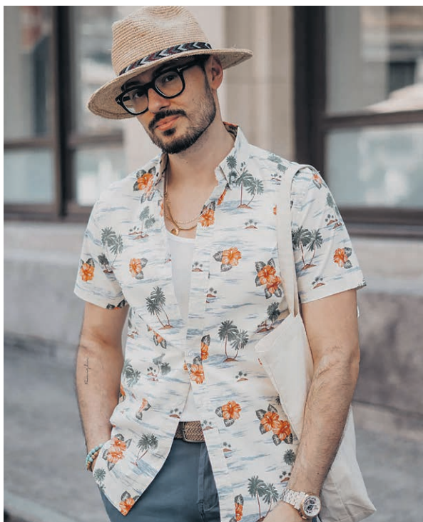
Le magasin l'Aubainerie, de Val-d'Or, doublera sa superficie et offrira des produits de qualité rehaussée.