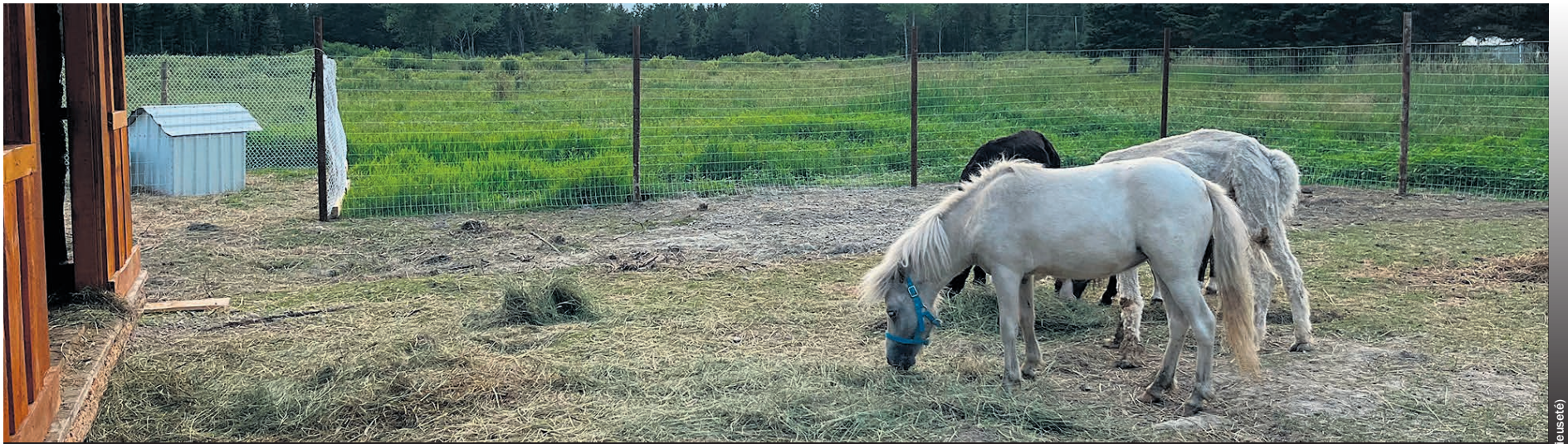
Les animaux de la ferme touristique vous attendent à Belcourt.