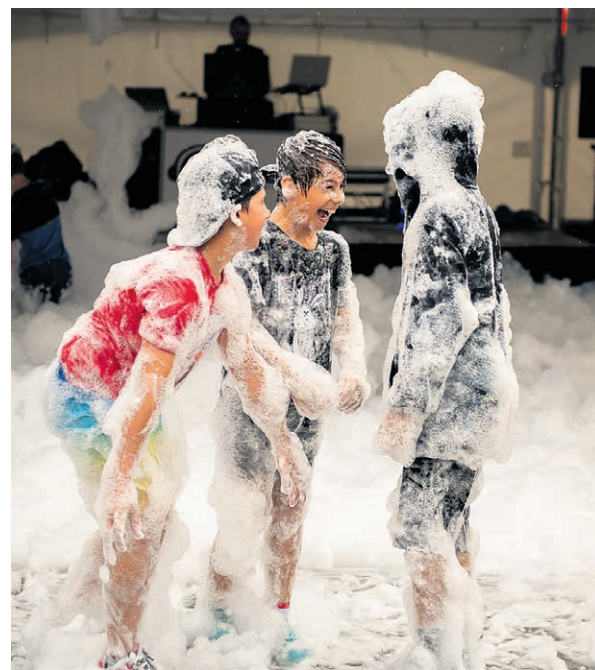
H2O le festival c'est aussi une foule d'activités gratuites pour petits et grands, dont le foam party: fort de son succès.