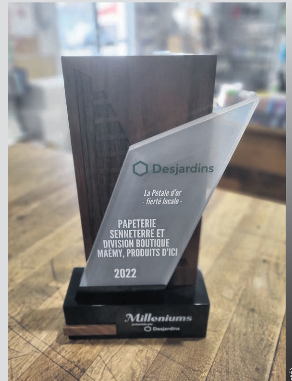
Trophée remis l'an dernier à l'entreprise coup de cœur du jury.