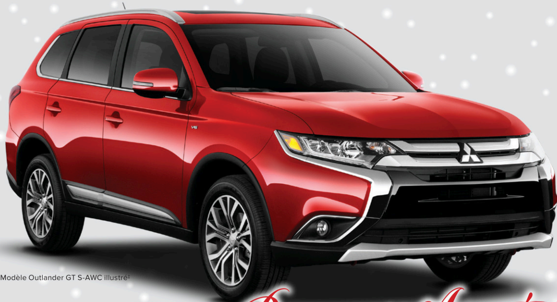
Modèle Outlander GT S-AWC illustré 1