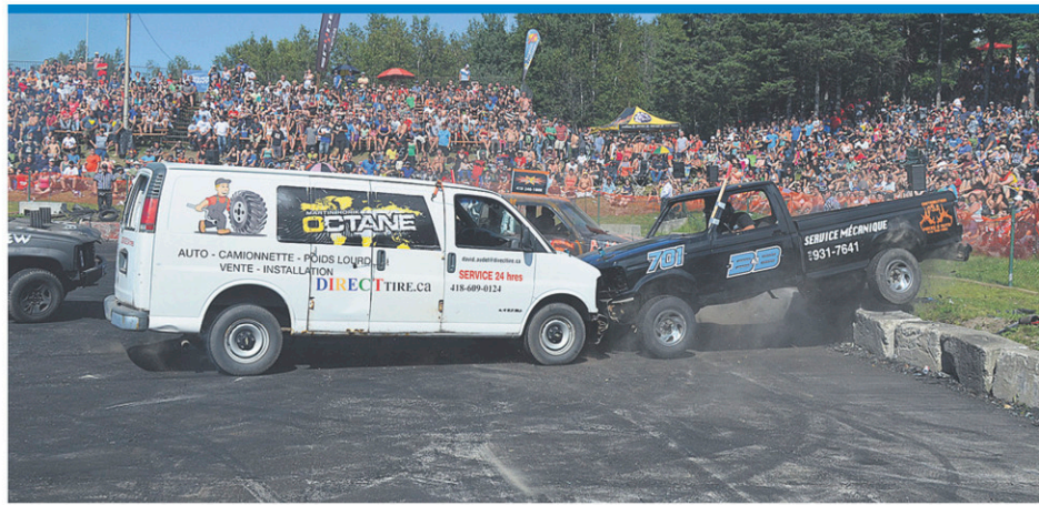
Les adeptes de tôle froissée et de sensations fortes devront dire adieu au Festival des Barres-à-Jack qui ne sera pas de retour en 2016.

La vente de bûches de Noël a permis d'amasser un peu plus de 25 000 $ qui ont été remis à la société Saint-Vincent-de-Paul de Québec. (A.H.)