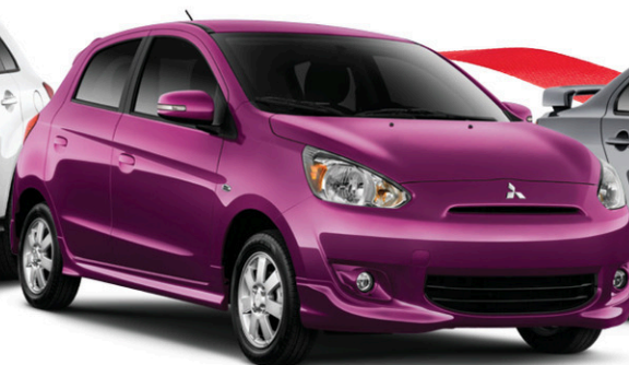
Modèle Mirage SE illustré 1

À PARTIR DE 11 493 $* La moins cher sur le marché