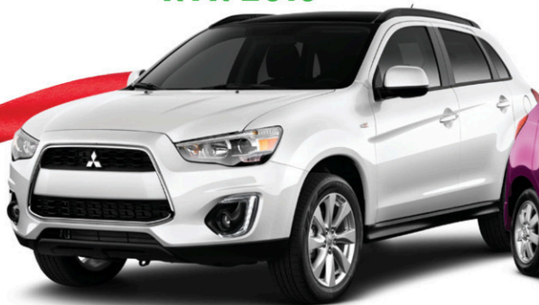
Modèle RVR GT AWC illustré 1

À L'ACHAT SUR 84 | 60 $* MOIS 1 | SEMAINE