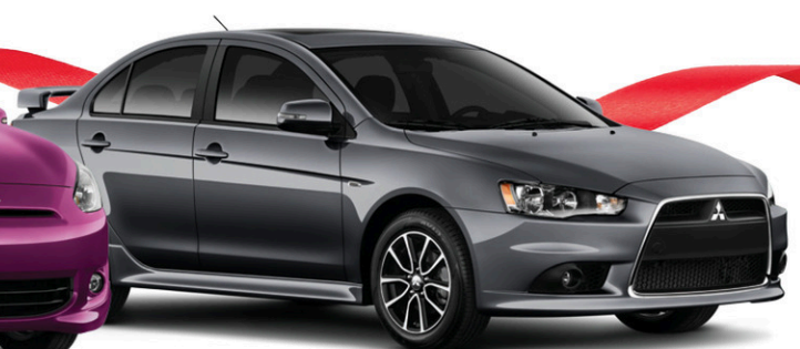
Modèle Lancer GT AWC illustré 1

À L'ACHAT SUR 84 | 47 $* MOIS 1 | SEMAINE