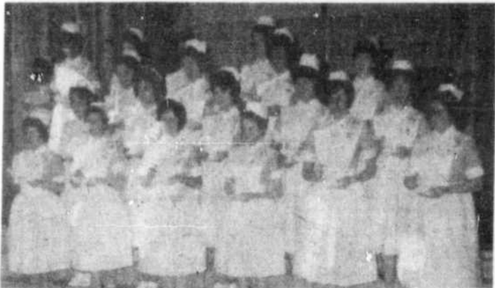
Voici le groupe de gardes-malades auxiliaires.

A toutes et à chacune, nous souhaitons, plein succès et parfaite réalisation dans leur si noble vocation. Sincères félicitations aux vingt étudiantes gardes-malades auxiliaires, aux onze gardes-bébés et aux deux étudiants infirmiers dont la qualité prédomine la quantité.