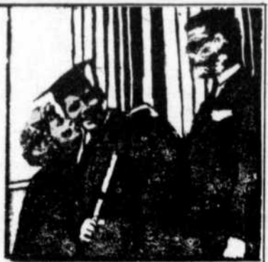
Les plans d'éducation de la Compagnie d'Assurance New York Life

MOYEN ASSURE DE POURVOIR AUX FONDS NECESSAIRES POUR LE COLLEGE