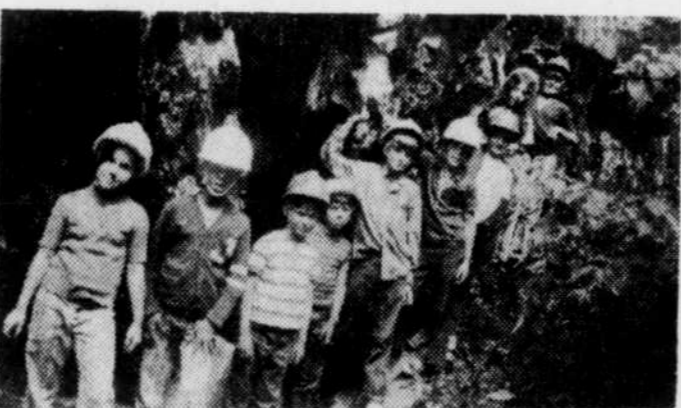
Le groupe d'escalade (6-11 ans) de la Base Plein Air de Lac-Mégantic.

Premiers arrivés, premiers servis; toutes les disciplines sont disponibles. L'équipe de la base vous invite à camper avec elle.