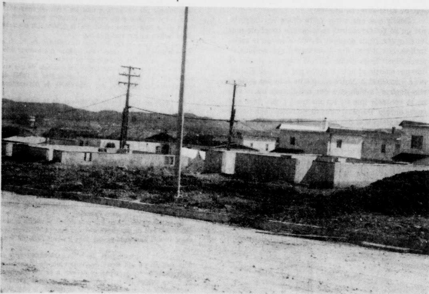
Plusieurs fondations dans le secteur du nouveau St-Maurice sont déjà prêtes à recevoir leurs maisons. On voit que la phase no 2 du déménagement de l'ancien St-Maurice débutera le lundi 31 juillet courant.