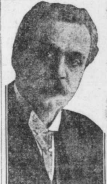
L'HONORABLE JUGE L.-P. PELLETIER, le nouveau membre de la magistrature de la cour supérieure du district de Montréal.

La cérémonie de l'assermentement de l'honorable juge Louis-Philippe Pelletier a rassemblé, ce matin, une foule nombreuse d'avocats, de magistrats et d'amis du nouveau