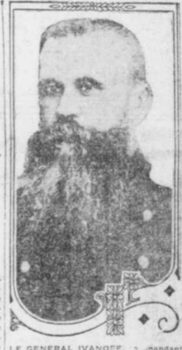
LE GENERAL IVANOFF, commandant en chef de l'armée russe qui combat au sud-ouest, entre Przemska et Cracovie.

Londres, 1er. — Le bureau officiel de la presse, annonce que le roi George est parti pour la France où il doit visiter les quartiers généraux du corps expéditionnaire anglais. Le roi est accompagné de son secrétaire privé, le baron Stamfordham et de son écuyer, le major Wigram ainsi que de plusieurs membres de sa suite. D'après une dépêche du correspondant du Reuter dans le nord de