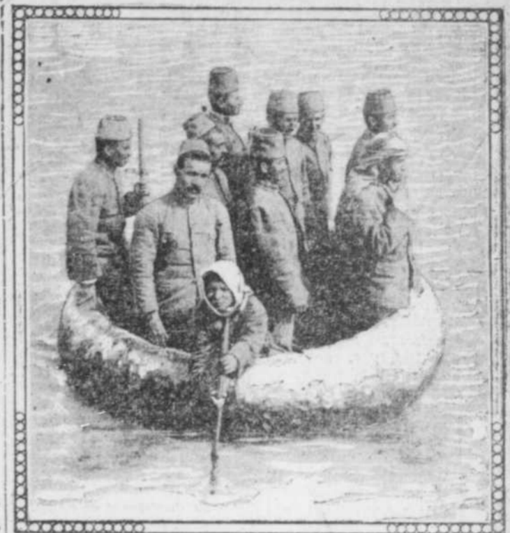
FEMMES TURQUES FAISANT TRAVERSER UNE RIVIERE AUX SOLDATS TURCS DANS UN BATEAU CIRCULAIRE. Cette photographie représente une escouade de soldats turcs traversant le Tigre, à Bagdad, dans un de ces vaisseaux circulaires employés depuis les jours de l'ancienne Babylone. Les femmes turques qui conduisent le bateau font ce qu'elles peuvent pour aider à l'armée dans la guerre contre les chrétiens méprisés. Photo Underwood & Underwood, N.Y.

Budapest, via Londres, 1er.—La "Gazette Officielle" publie un décret prolongant le moratorium jusqu'au 31 janvier et lui faisant, en même temps, subir certaines modifications.