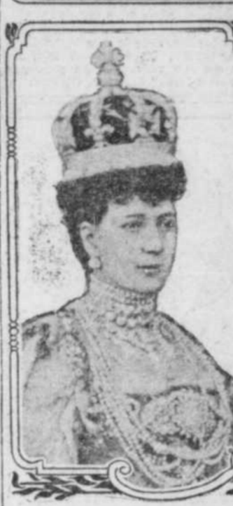
S. M. LA REINE ALEXANDRA, mère de notre auguste souverain, le roi George V d'Angleterre et veuve du feu roi Edouard VII, célèbre aujourd'hui le 70ième anniversaire de sa naissance.