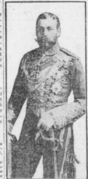
SA MAJESTÉ LE ROI GEORGES V, rendu visite à ses troupes, en France.