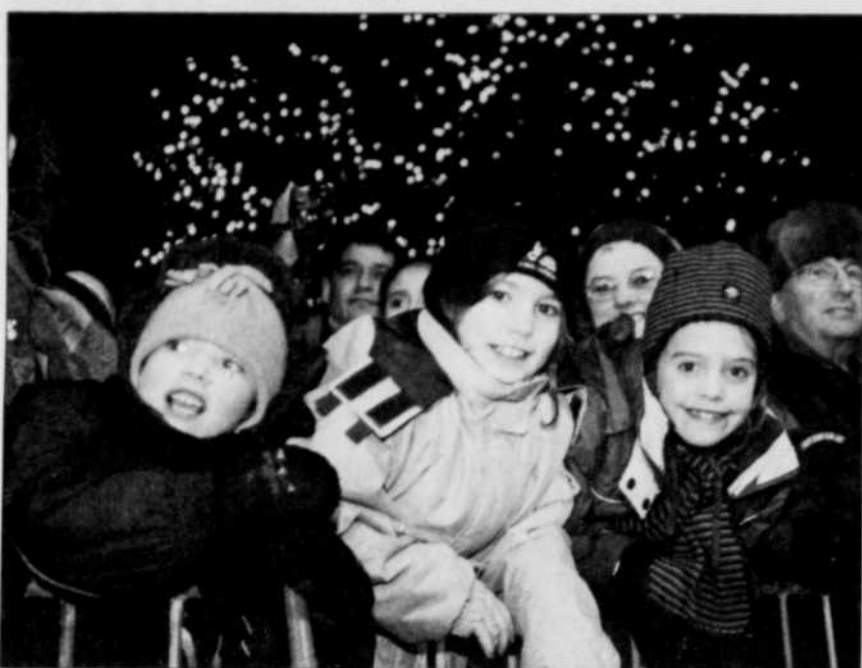
La tradition des beuveries carnavalesques se perd, a pu constater LE SOLEIL, hier, au défilé. Le virage famille est apparemment parvenu à éroder ce rite de passage. Et à voir la frimousse réjouie des enfants coincés entre les barreaux de clôture, il semble que la jeu en ait valu la chandelle.

Les policiers, eux, n'ont pas eu trop de pain sur la planche. Ils ont seulement procédé à deux arrestations pour désordre. Les deux carnavaliers, qui avaient trop levé le coude, ont été libérés sous constat.