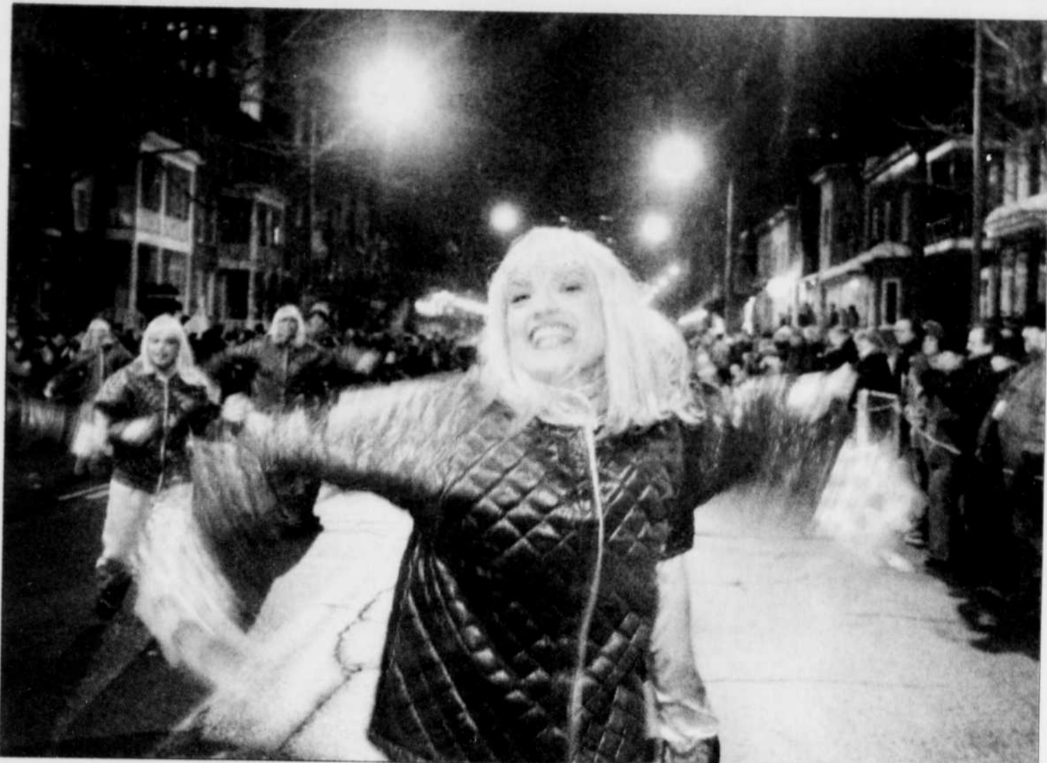
La température clémente a non seulement attiré une foule de 145 000 personnes le long du parcours du défilé de la haute ville, elle a également permis aux chars et aux majorettes de réduire la cadence, faisant ainsi durer le plaisir un peu plus longtemps.