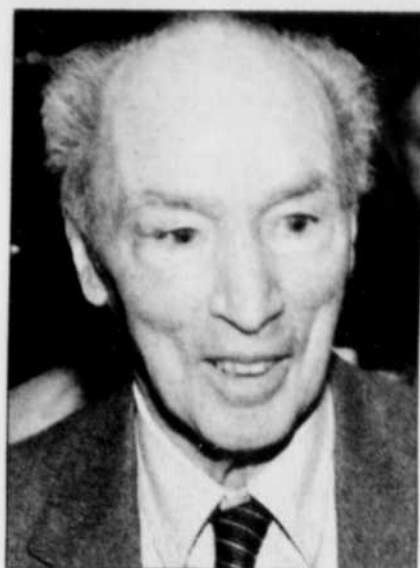
Pierre Elliott Trudeau en 2000

Le premier ministre fédéral actuel, Jean Chrétien, est le premier choix parmi les hommes politiques encore vivants, avec 2% des voix. M. Chrétien