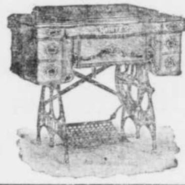
TABLE DE PAIEMENTS FACILES :

Vous faites mieux de venir immédiatement et de prendre connaissance de ce plan.