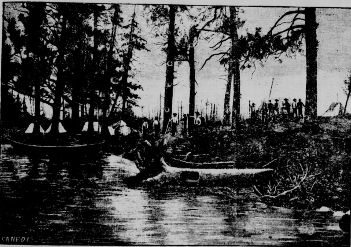
HAUT-CANADA. — Un poste des partisans de la guerre du Canada; d'après un croquis de M. l'abbé Paradis

Nous avons prié si fort, nous avons frappé à coups si redoublés, nous avons demandé avec tant d'instance, qu'enfin une bonne brise souffle en poupe. A minuit, aux lueurs d'un brasier que le vent courbe et relève, allant et venant en silence comme des ombres, nous plions les tentes et nous chargeons le bagage. Avec tâtonnements, sondant de l'aviron, contournant un rocher, suivant