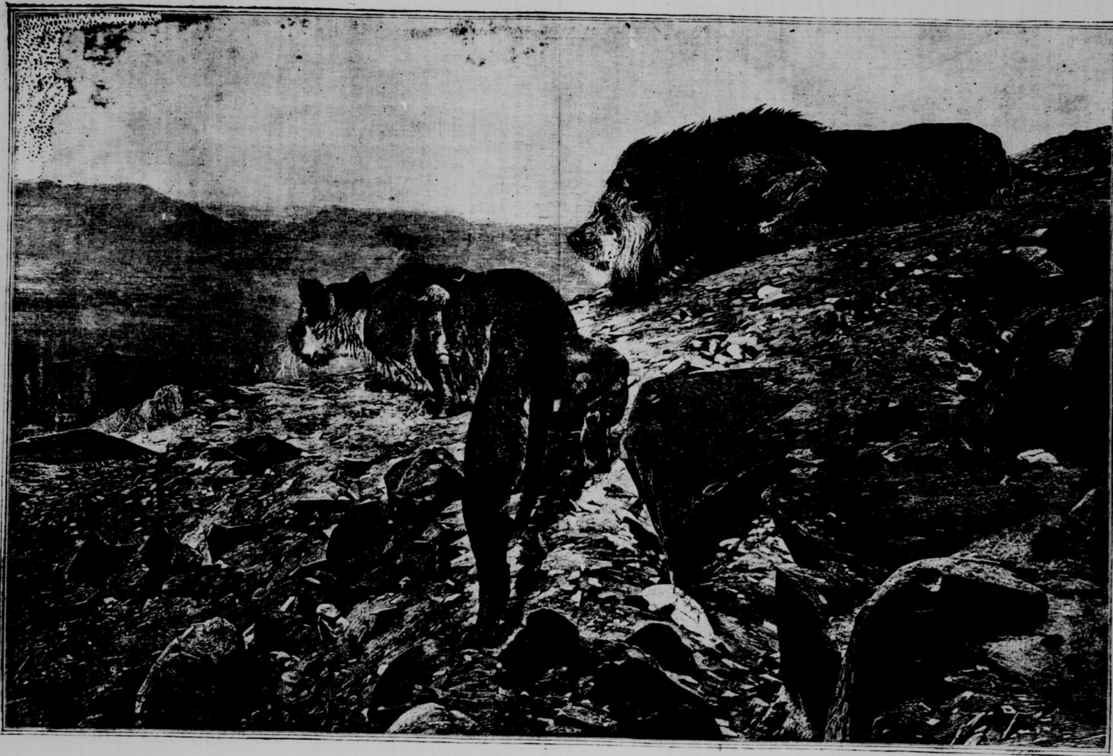
LES BRIGANDS DU DÉSERT