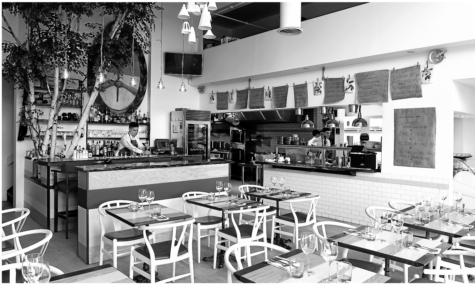
Au Lavanderia, on a l'impression de se retrouver au jardin.

Une partie des frais de ce reportage ont été payés par le ministère du Tourisme espagnol.