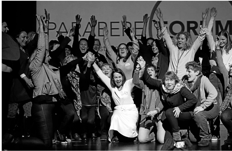
Des femmes influentes du monde de l'alimentation se sont réunies le week-end dernier à Bilbao, au Pays basque, à l'occasion du forum Parabere. Elles ne cessent de trouver des occasions de se faire voir et de se faire entendre.

Parabere – le nom d'une mythique cuisinière basque – accueillait des