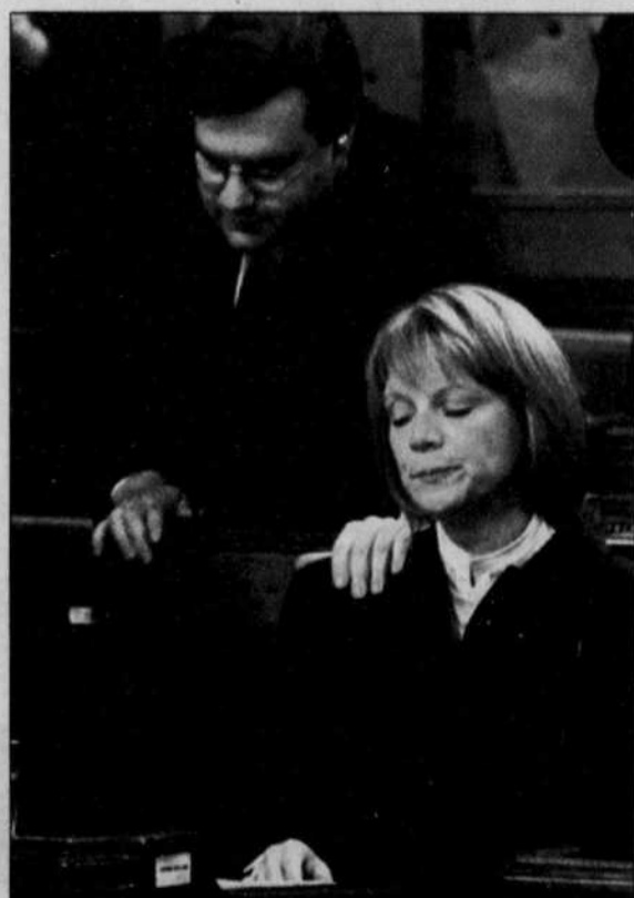
Denis Coderre réconforte sa collègue Jane Stewart.