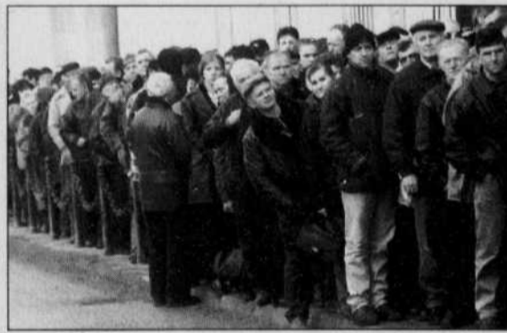
Des Croates de Bosnie font la file devant le consulat croate à Sarajevo croate pour se prévaloir de leur droit de vote.

Ce dernier était le candidat de la coalition des quatre plus petits partis de la nouvelle majorité de centre-gauche.