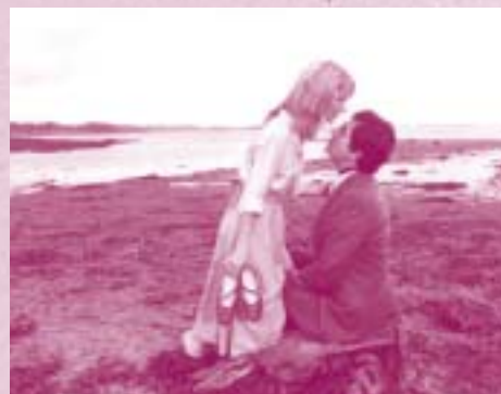
Mon oncle d'Amérique (A. Resnais)