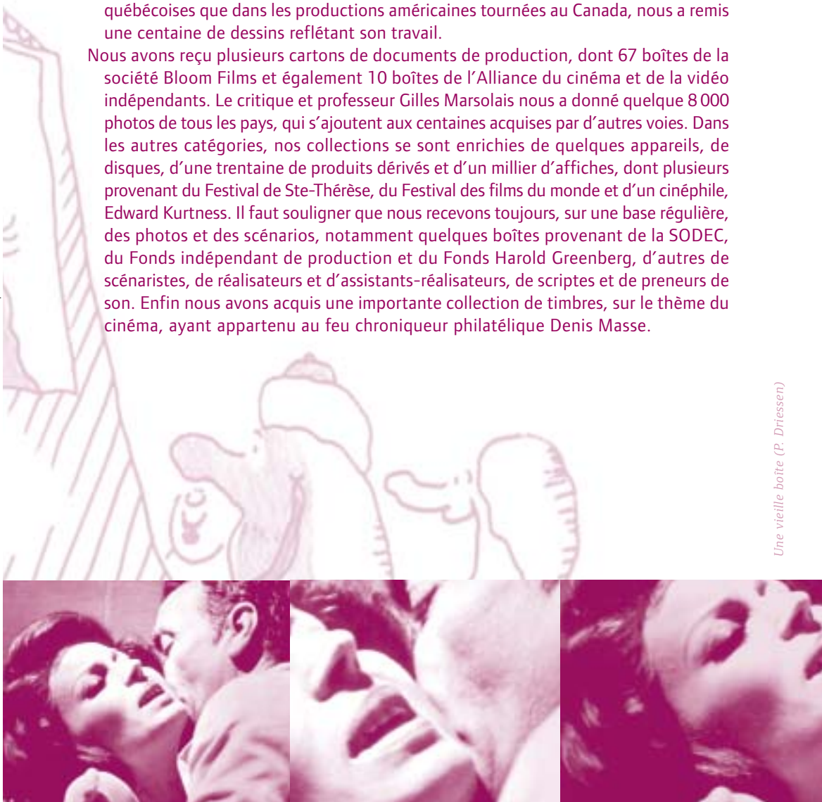
Une vieille boîte