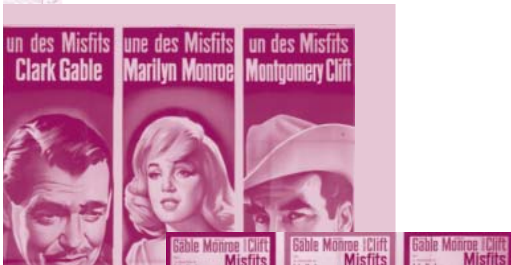
Affiches des Misfits (J. Huston)

Aleksandar Marks Dans les années 60, Aleksandar Marks a signé quelques-uns des films les plus intéressants de l'École de Zagreb. Il est décédé en 2002. Sa mémoire a été honorée à l'occasion d'une projection de courts métrages.