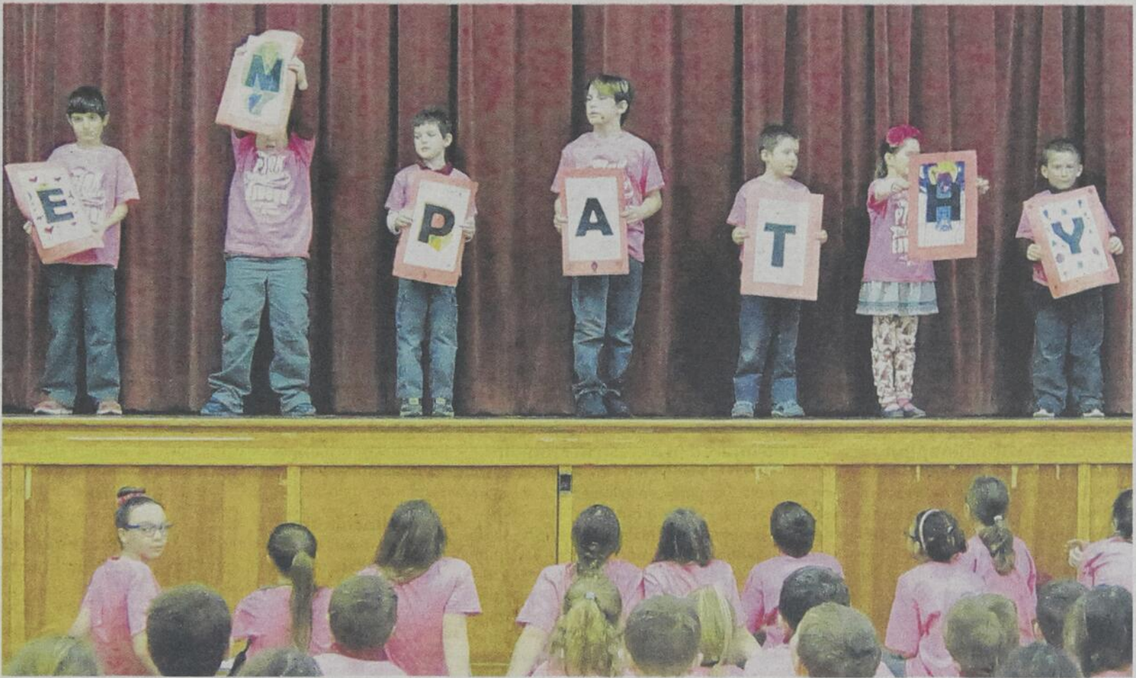
Students took the stage and did a brief performance to the Empathy Song. By the time the assembly had finished, each and every student in the school had participated in the action in one way or another.

The assembly was run by student council and they made sure that every one of the students in the school was actively involved in participating in the event. One stand-out moment that exemplified this spirit was the way they chose to kick-off the assembly: Students walked to the forefront of the gymnasium in a sullen manner bearing signs with mean things that a bully might say to them