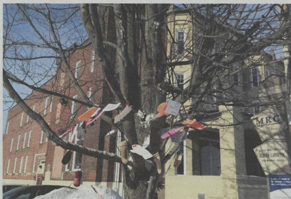
The garland was to remain in place for at least a period of one week.

On his part, Mr. McKenzie asked them to give the structure the chance to be implemented.