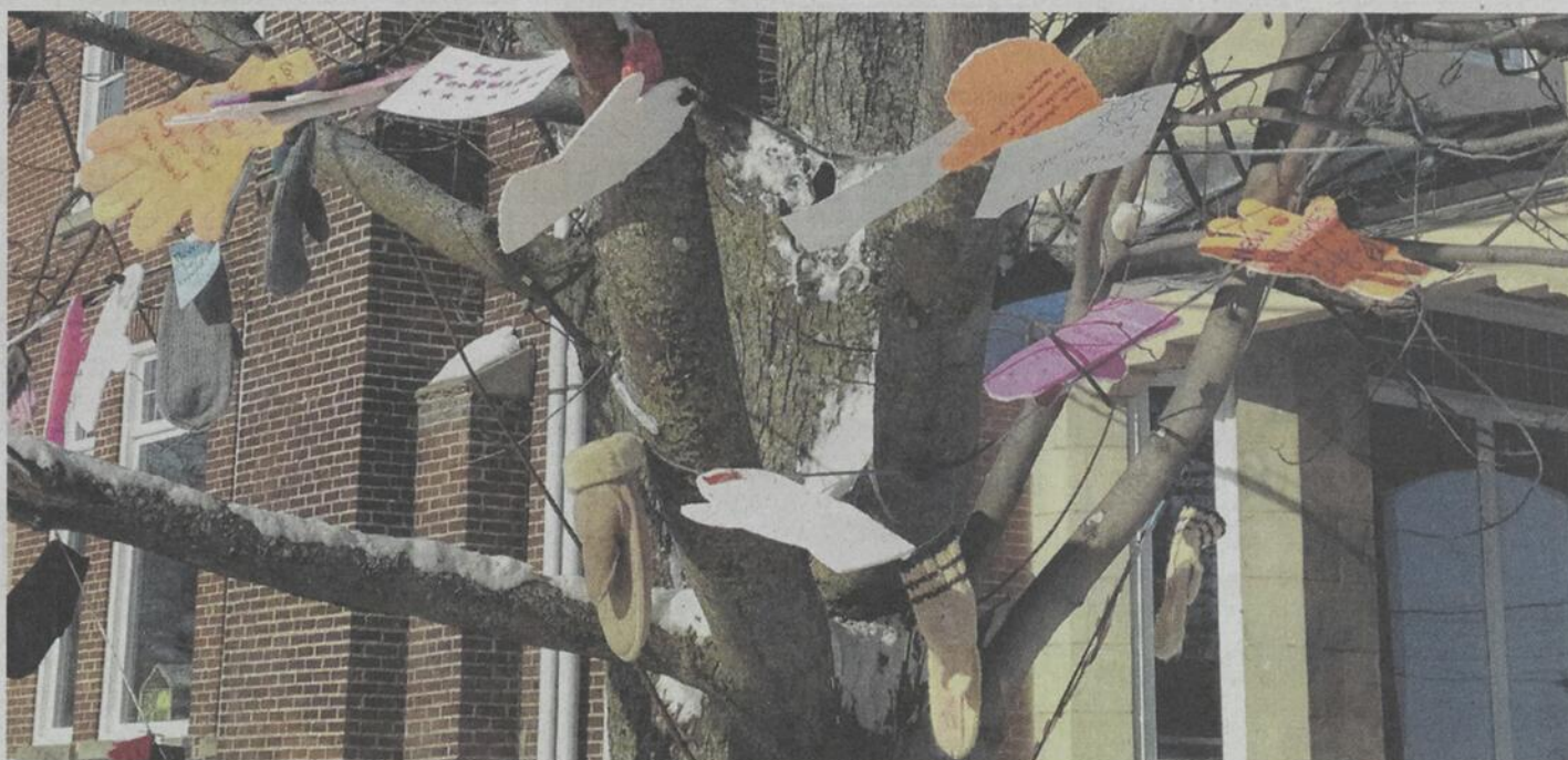
La guirlande, apposée dans le cadre de la Semaine d'actions dérangeantes devait demeurer en place pour au moins une semaine.