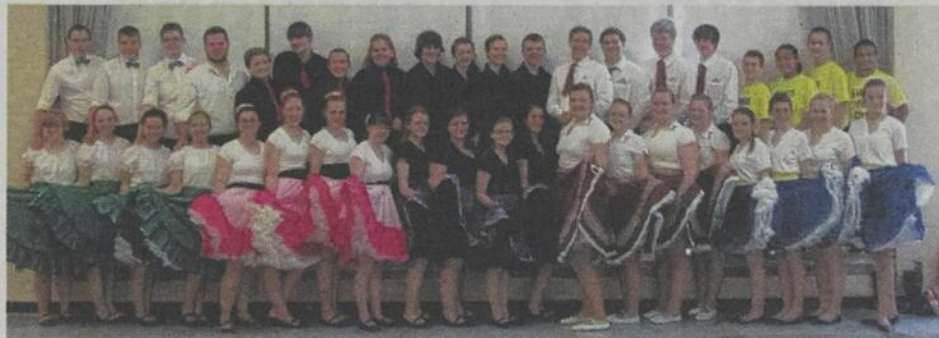
Pictured above are the senior teams who competed. They are, from left to right: MAC/JAC (Macdonald Campus, John Abbott), Ormstown, Richmond, Lachute and Howick.

SQUARE DANCING. On Sunday February 22, eighty spectators gathered on Macdonald Campus in Sainte-Anne-de-Bellevue to cheer on ten teams of dancers at the 4th annual Quebec 4-H Provincial Square Dance Competition.