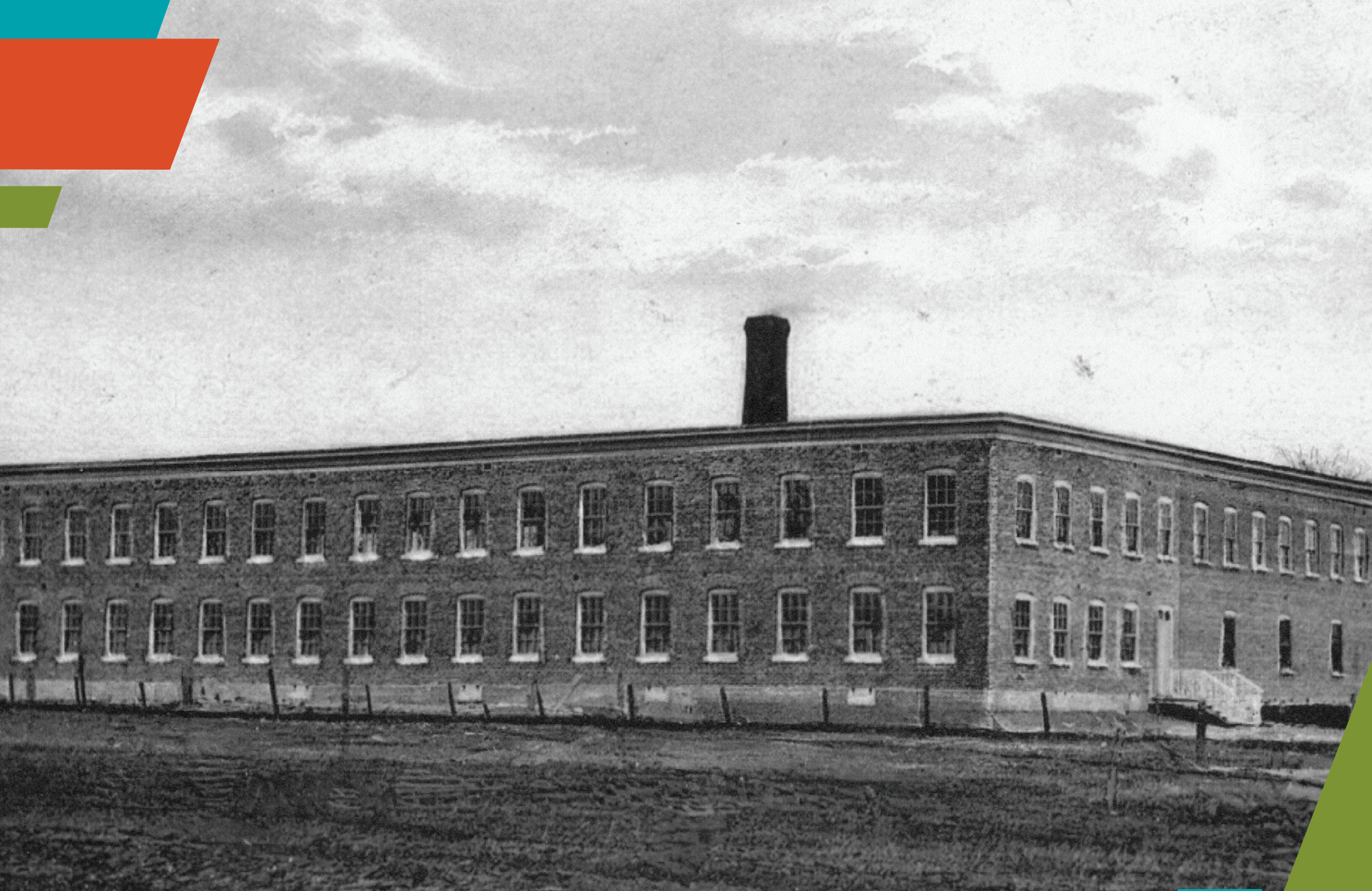
KNITTERS LTEE. MARIEVILLE P.Q.