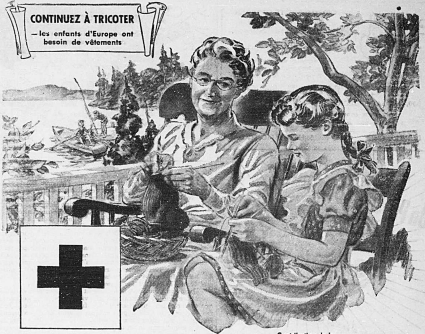
Contribution de la BRASSERIE "BLACK HORSE" DAWES

— les enfants d'Europe ont besoin de vêtements