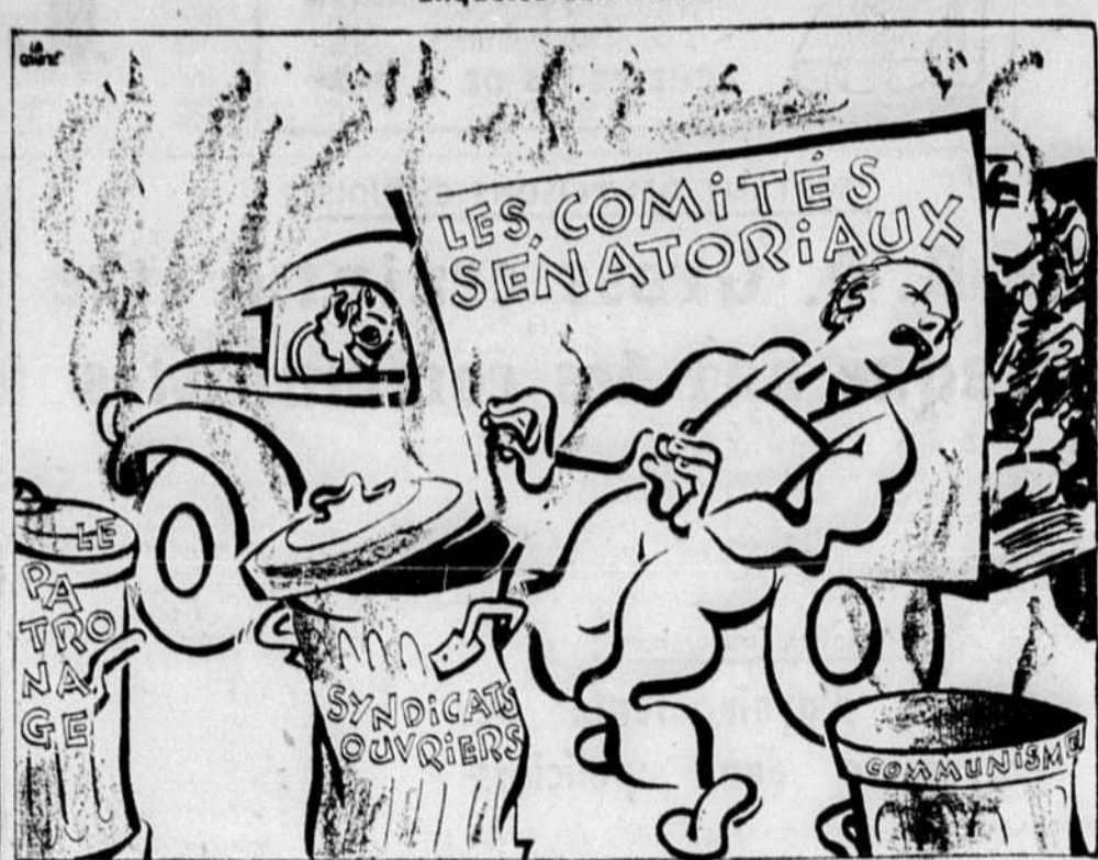
Ça sent de plus en plus mauvais