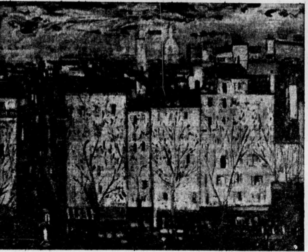
"Paysage parisien" de Robert Savary. (Page de France no 13.046).