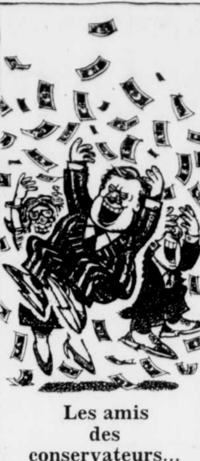
Les amis des conservateurs...