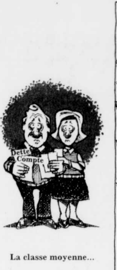
La classe moyenne...