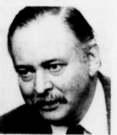
Le nouveau président du PQ, Jacques Parizeau

J'ai suivi avec beaucoup d'intérêt votre campagne et surtout votre discours de samedi soir retransmis seulement par la radio. Vous avez eu votre première rasade de la potion que la radio-télévision d'État réserve aux partis qui ne sont pas au pouvoir. Je n'ose pas m'élever contre la conspiration du silence qui constitue pour un homme politique une drogue amère et un peu humiliante, mais je ne puis m'empêcher de communier à votre frus-