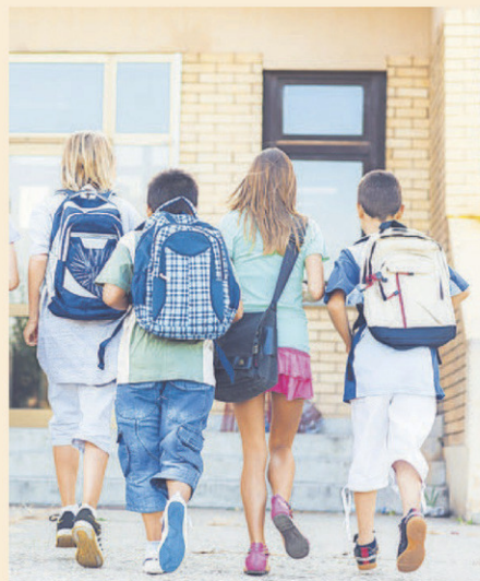
Les élèves entreprennent une nouvelle année scolaire de 180 jours le mercredi 30 août.

La semaine de relâche scolaire aura lieu du 4 au 8 mars et une journée pédagogique suivra le lundi 11 mars.