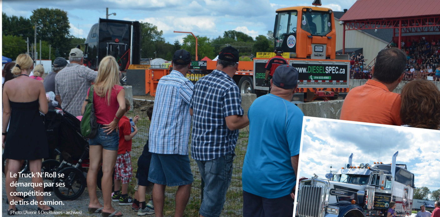
Le Truck 'N' Roll se démarque par ses compétitions de tirs de camion.