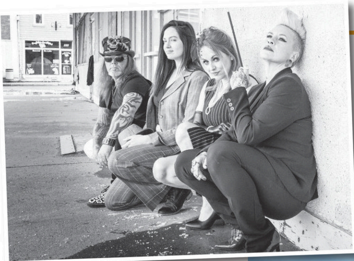
Le Landy Rose Band est attendu sur scène le samedi à 19 heures.