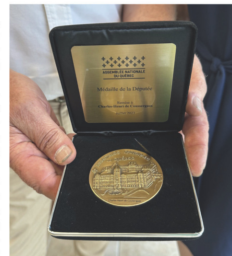
La médaille de la Députée est décernée chaque année, par les élus de l'Assemblée nationale, à une ou deux personnes de leur circonscription.