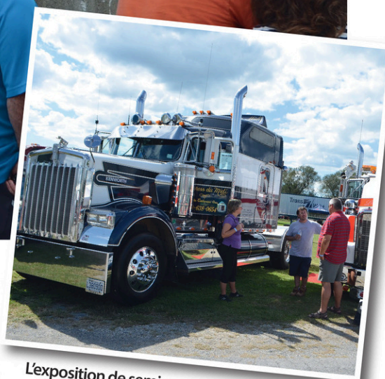
L'exposition de semi-remorques retient l'attention des petits et grands. (Photo: L'Avenir & Des Rivières - archives)

(Photo: L'Avenir & Des Rivières - archives)