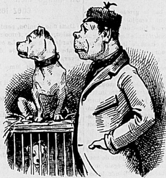
De l'influence du métier sur le physique