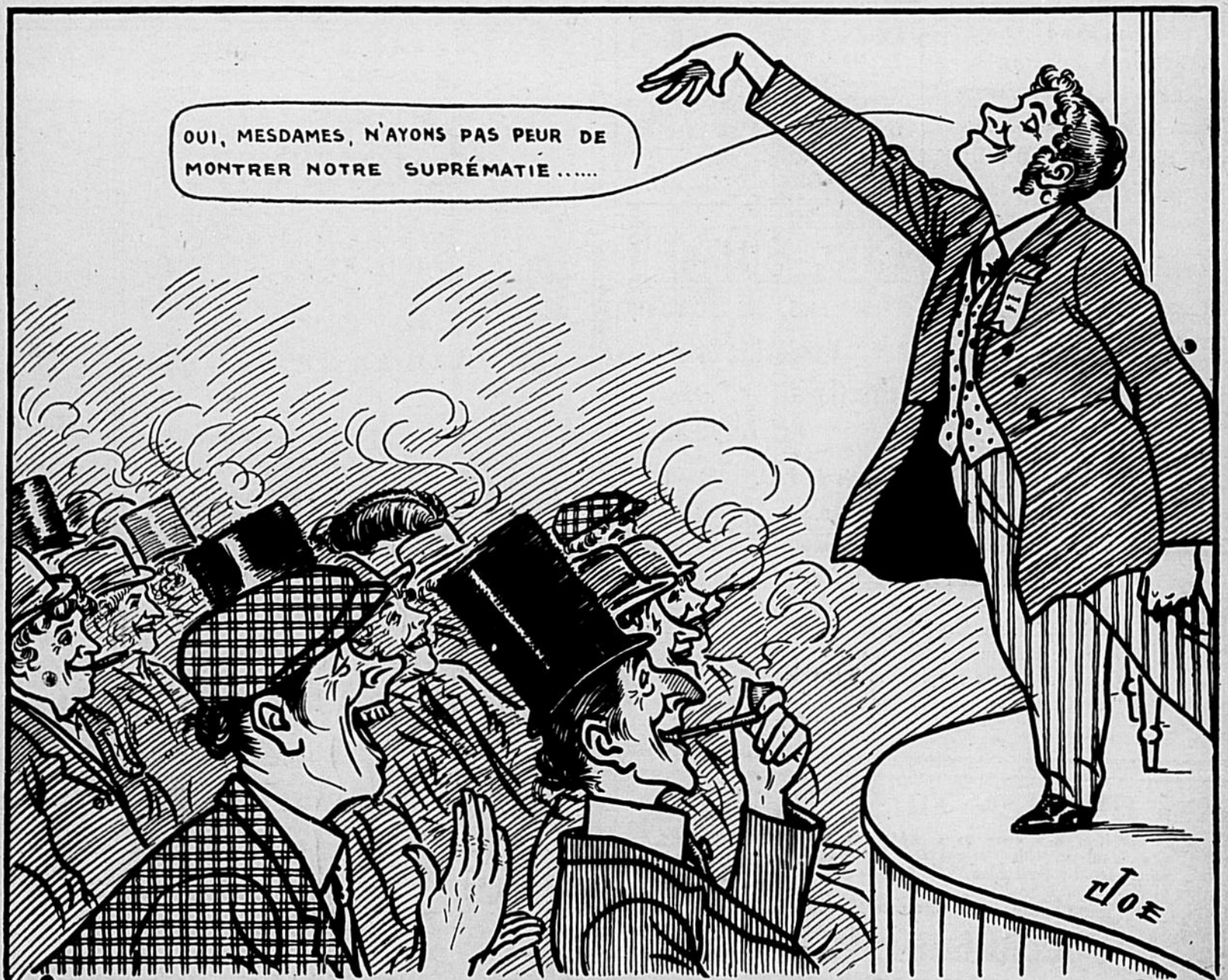
Curieuse assemblée de "Dames"