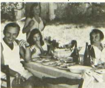
Pleure pas la bouche pleine

L'anecdote est assez mince et le film vaut surtout par la peinture qu'il fait, par petites touches, de la vie dans un village de province. Les scènes se succèdent, courtes et précises, pour former une mosaïque champêtre où s'ébauche une éducation sentimentale plus naturaliste que romantique. Les personnages sont dessinés avec vérité et naturel par une distribution où des comédiens chevronnés côtoient des débutants et des non-professionnels.