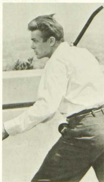
La Fureur de vivre

Cette production, après bien d'autres, veut être un cri d'alarme à propos de la délinquance juvénile et de l'irresponsabilité des parents. Toutefois, dans son ensemble, l'oeuvre manque de nuances et la charge contre les parents est exagérée. Le film n'en possède pas moins de réelles qualités tant sur le plan symbolique que sur le plan technique. L'interprétation est remarquable et les acteurs, notamment James Dean, vivent leur rôle avec beaucoup d'intensité.