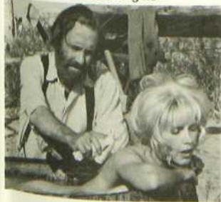
Un nommé Cable Hogue

Pour se reposer sans doute de la violence de son film précédent The Wild Bunch , Peckinpah a composé là un western détendu, dominé par la gaillardise et la joie de vivre. Le décor y est presque limité au seul point d'eau exploité par le héros en plein désert et les personnages sont réduits à une demi-douzaine. Le cinéaste manifeste pourtant avec virtuosité son sens de l'image et surtout sa façon particulière d'évoquer cette époque de la fin du vieil Ouest qu'il affectionne. L'interprétation est d'un naturel savoureux.