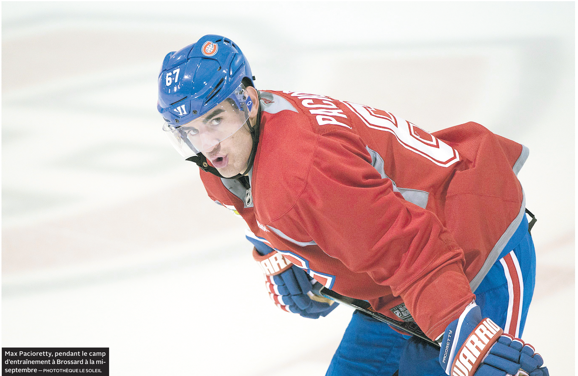
Max Pacioretty, pendant le camp d'entraînement à Brossard à la mi-septembre