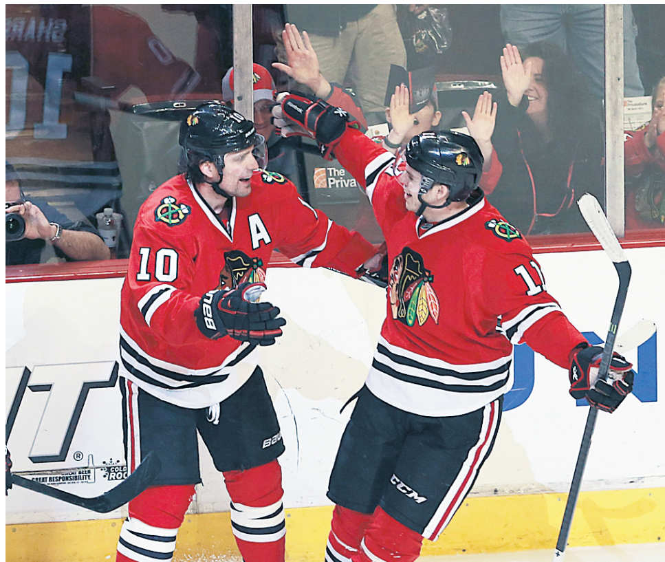
Membre des Blackhawks au cours des 10 dernières saisons, Patrick Sharp (10) jouera dorénavant avec les Stars de Dallas.

Plus d'une vingtaine de joueurs autonomes avaient à ce jour trouvé preneur. Du nombre, cinq ont paraphé des ententes de plus de 20 millions $, soit Andrej Sekera (Oilers) et Jeff Petry (Canadien), dont les contrats dépassent la barre des 30 millions $, Carl Soderberg (Avalanche) Devan Dubnyk (Wild) et Michael Frolik (Flames). À noter que Petry et Dubnyk sont demeurés avec l'équipe avec laquelle ils avaient terminé la campagne 2014-2015. Mike Green (Red Wings), Paul Martin (San Jose) et Matt Beleski (Bruins) ne sont pas en