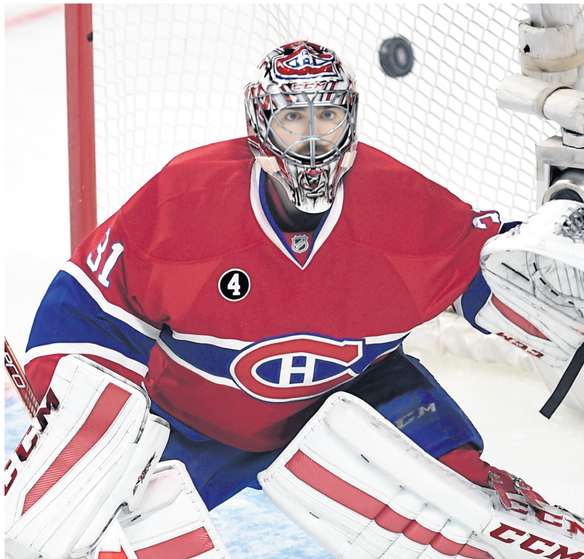
Quand Carey Price dit qu'il peut faire mieux cette année qu'il l'a fait en 2014-2015, il laisse peut-être sous-entendre qu'il veut mener les siens plus loin en séries qu'il ne l'a fait la saison dernière.

Le dernier porte-couleurs du Canadien à avoir été choisi joueur le plus utile à son équipe avait été José Théodore, en 2002.