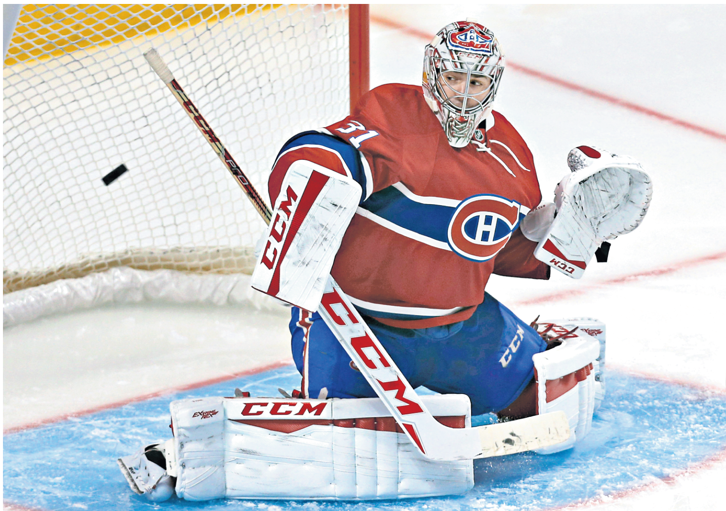
Le gardien Carey Price lors de la partie intra-équipe du Canadien de Montréal au Centre Bell le 20 septembre.

TEXTES DE JEAN-FRANÇOIS TARDIF ET CHRONIQUE DE KEVIN JOHNSTON