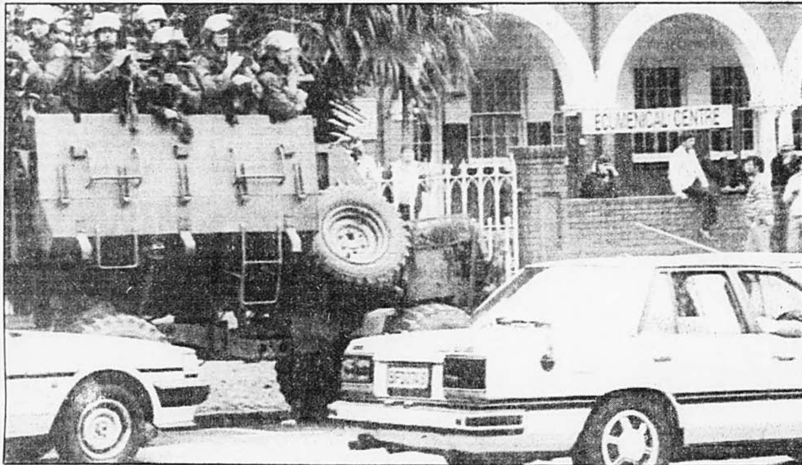
L'armée et la police ont uni leurs forces pour empêcher le public d'entrer dans le Centre oecuménique à Durban, en Afrique du Sud.