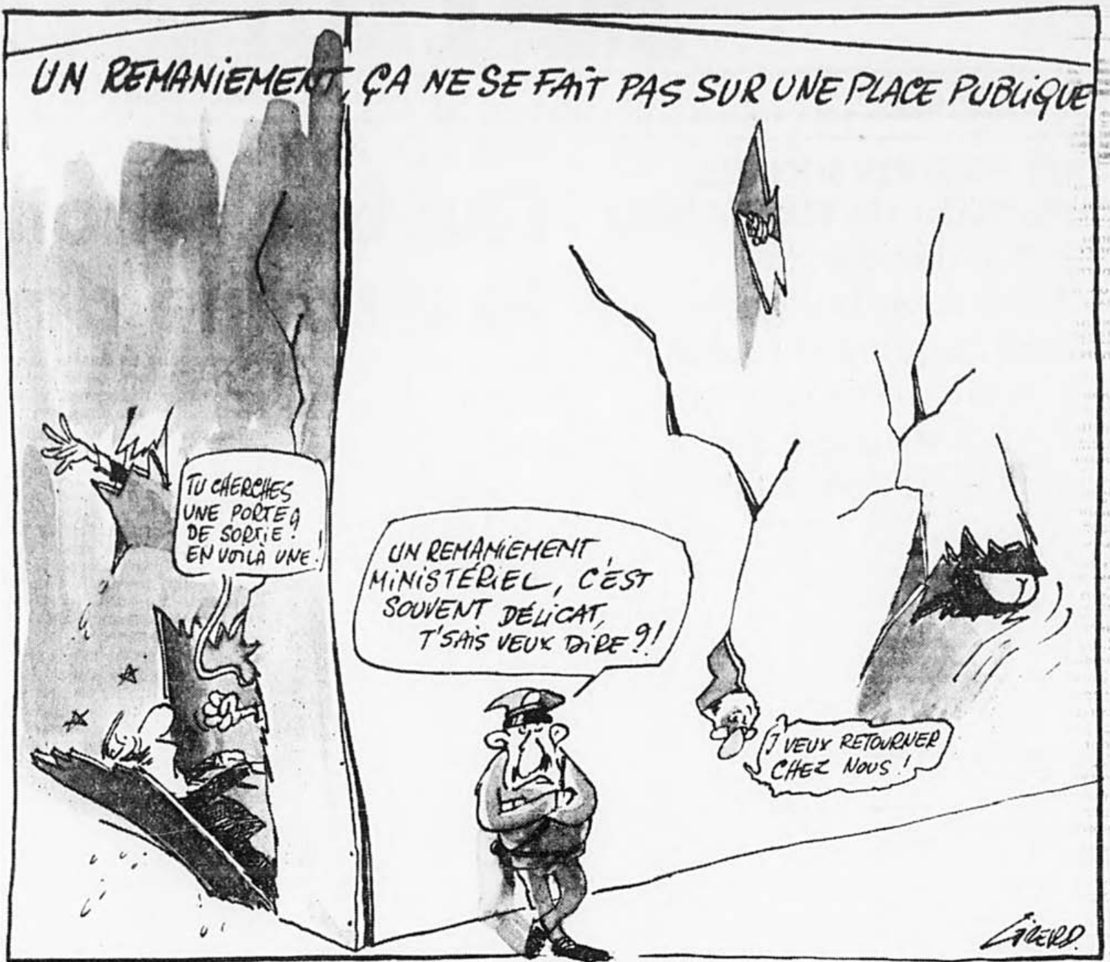
Reprise du 3 mars 1984