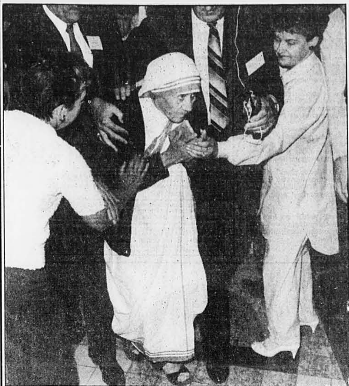
C'est d'un bon pas et entourée de « gardes du corps » que Mère Teresa a fait son entrée à la cathédrale de Montréal, hier matin. Cela n'a pas empêché plusieurs personnes de l'entourer de près, lui prodigant parfois des marques de vénération généralement réservées aux saints.