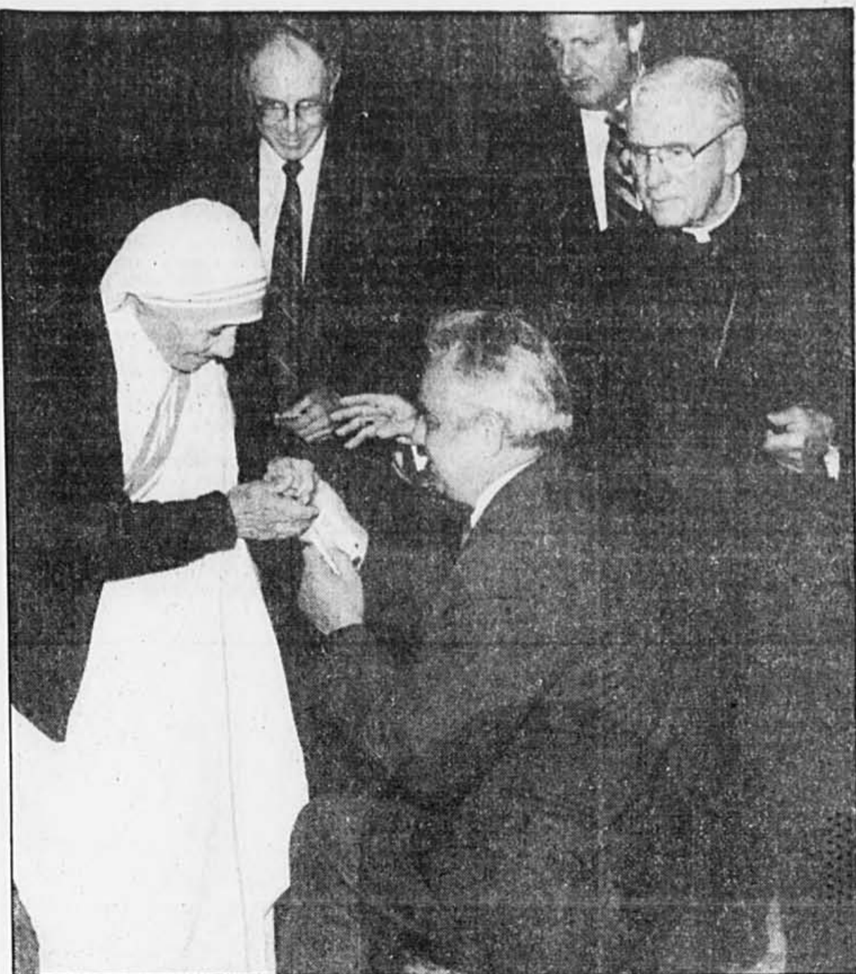
Lors du Déjeuner de la prière des chefs de file, des dirigeants d'entreprise et du monde des affaires ont manifesté leur admiration pour Mère Teresa en glissant dans ses mains des sommes d'argent parfois consistantes.