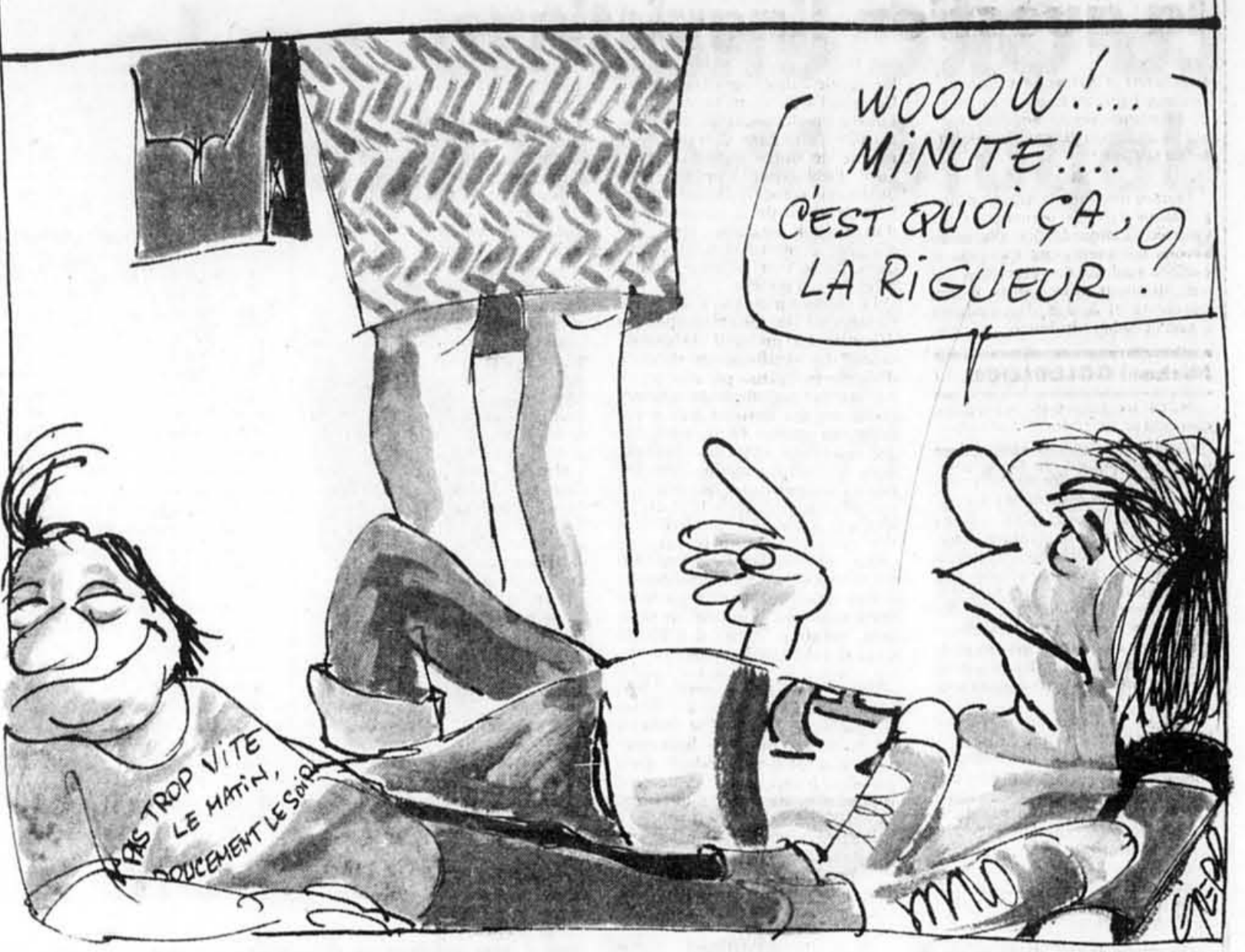
(Tous droits réservés)