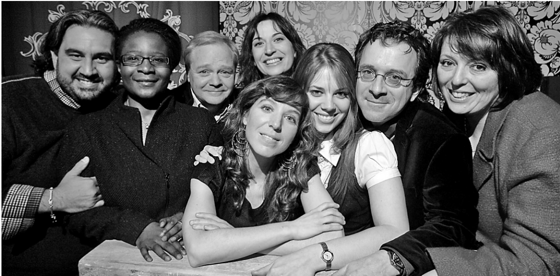
Le ténor Marc Hervieux et la soprano Marie-Josée Lord accompagnés des six participants d' Apéro à l'opéra .

Au total, 168 candidats ont répondu à l'appel lancé par l'Opéra de Montréal l'été dernier, qui souhaitait souligner son 30 e anniversaire en ouvrant ses portes à des amateurs pour leur offrir une formation lyrique avec des professeurs chevronnés. Parmi les aspirants, des gens qui exercent toutes les