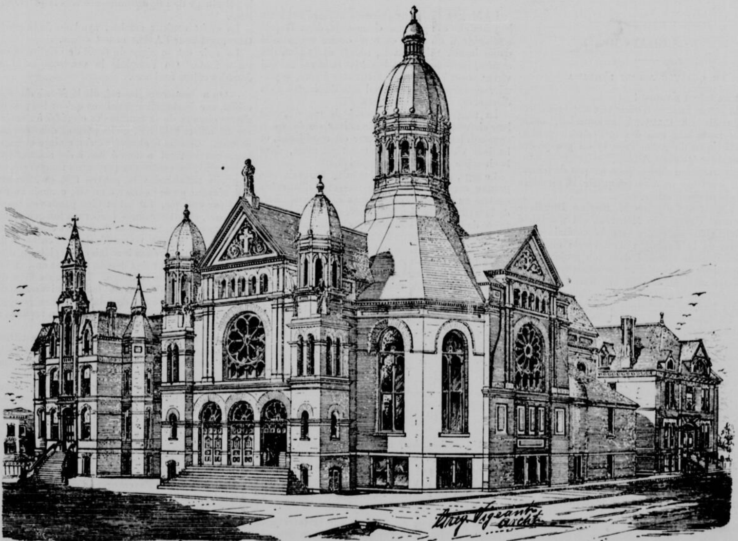
ETATS-UNIS.—EGLISE NOTRE-DAME, DE CHICAGO