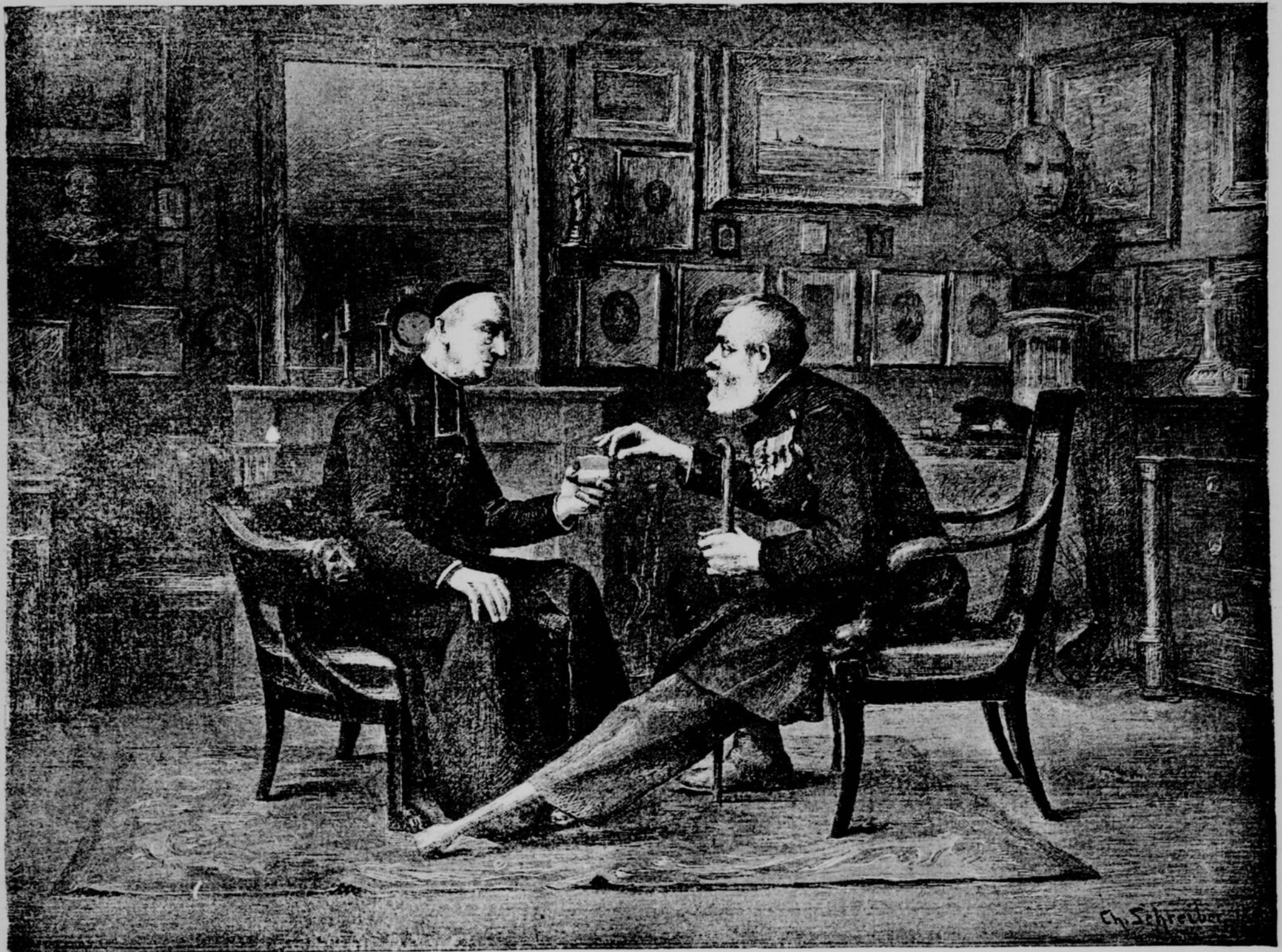
BEAUX-ARTS. — DEUX BRAVES