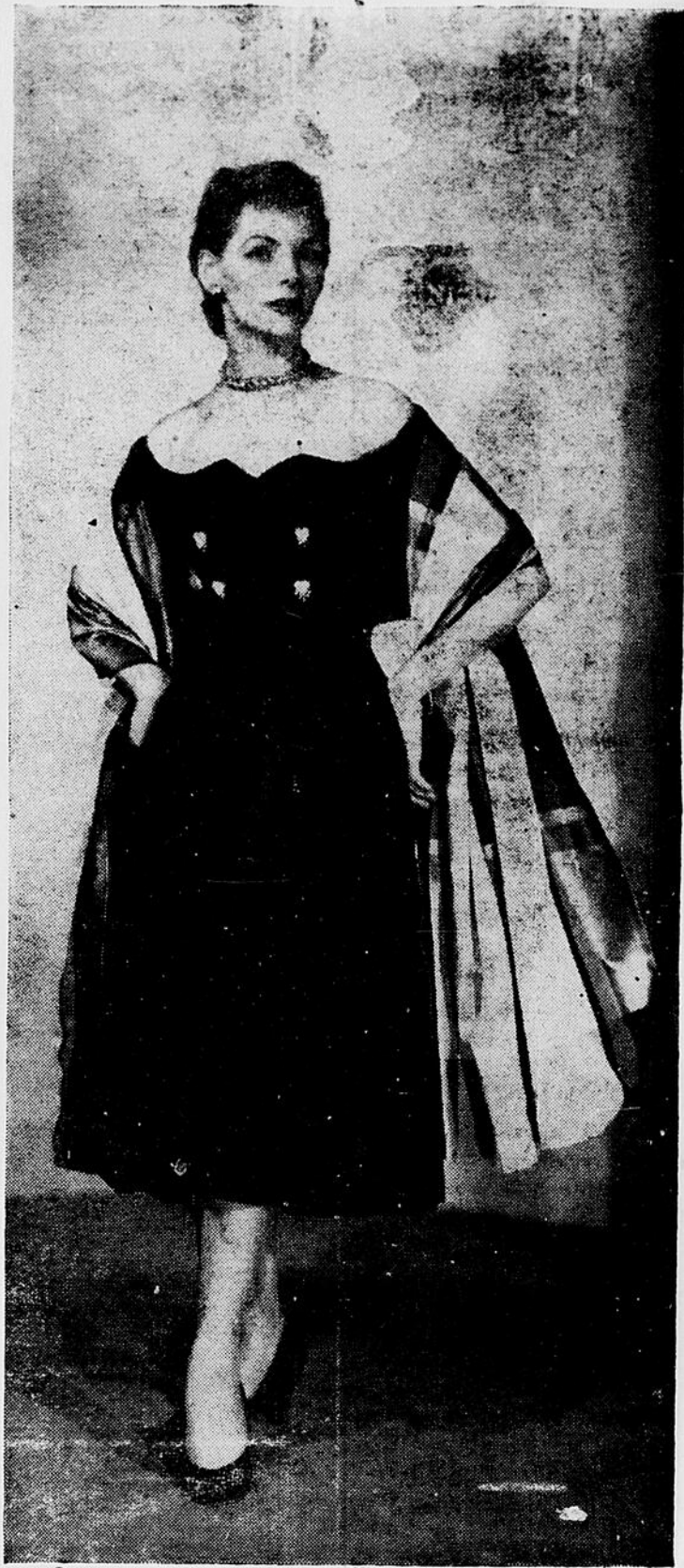
● Robe du soir en satin et soie et dont le corsage en forme de cœur est décoré de petits coeurs en pierres du Rhin. Les manches sont à la hauteur des coudes. L'écharpe est tissée en vert, gris et rouge sur fond blanc.

L'Asbestos Corporation, à Asbestos, a commencé et poursuit avec diligence des travaux d'agrandissement et d'amélioration de son usine, qui représentent une dépense de l'ordre de $14,000,000. "En même temps que se réalise ce développement extraordinaire", a déclaré M. Duplessis, "les ouvriers de la compagnie ont bénéficié de ce qu'ils avaient sollicité." Ils avaient