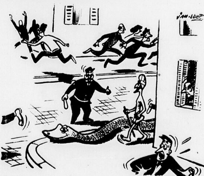
Vous ne pouvez pas le tenir en laisse, non ?