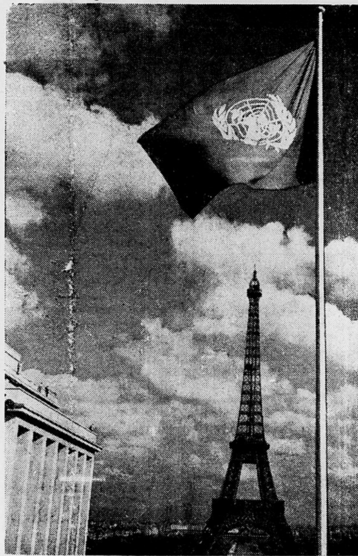
Le drapeau des Nations Unies flotte aujourd'hui à Paris sur le Palais de Chaillot, où sera inauguré, le 6 novembre, la sixième session de l'Assemblée générale de l'ONU. A l'arrière-plan... la Tour Eiffel.