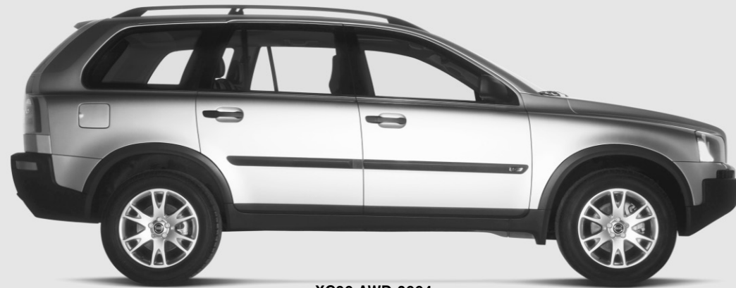
XC90 AWD 2004

/MOIS, 36 MOIS TAUX DE CRÉDIT-BAIL : 4,8 %