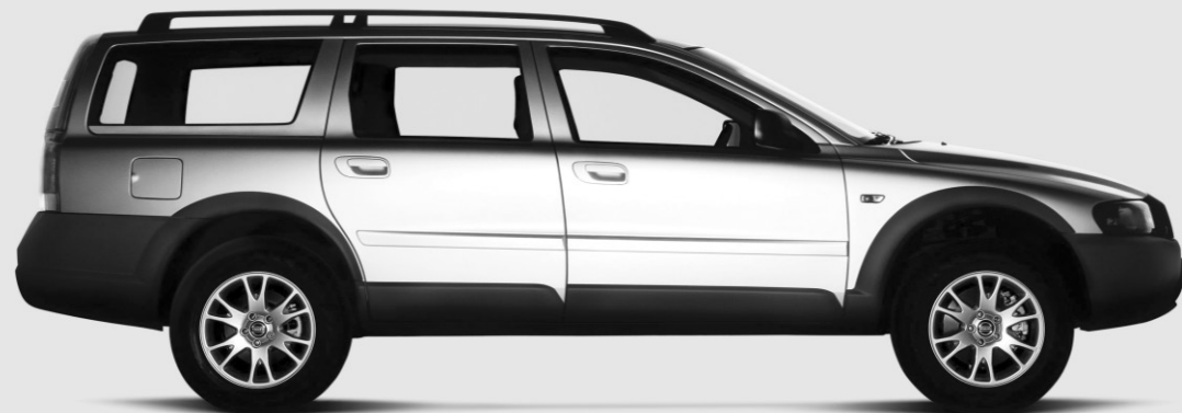
XC70 AWD 2004

/MOIS, 36 MOIS TAUX DE CRÉDIT-BAIL : 3,8 %