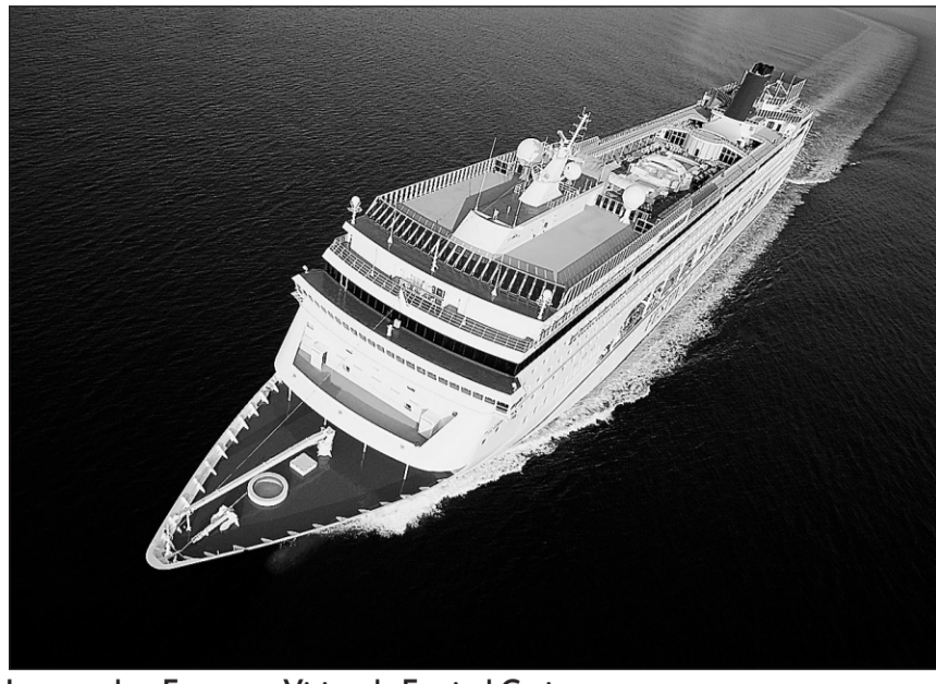
Le paquebot European Vision de Festival Cruises