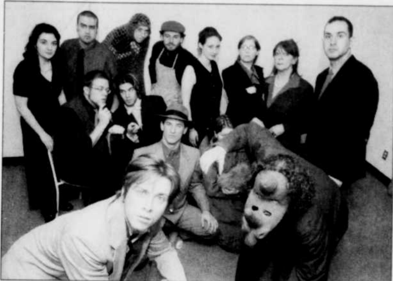
Les Treize présentent Rhinocéros

La Troupe de théâtre Les Treize présente Rhinocéros , de Eugène Ionesco, dans une mise en scène de Raymond Poirier, ce soir et demain soir, à 20 h, à l'Amphithéâtre Hydro-Québec du pavillon Alphonse-Desjardins. Dénonciation de tous les totalitarismes, de tous les conformismes, de toutes les idéologies de masse qui abrutissent l'être humain, cette pièce, écrite à la fin des années 1950 par un Ionesco troublé par les événements tragiques qui ont secoué l'Europe et le monde pendant les années 1930 et 1940, demeure terriblement actuelle. À travers l'ambiance musicale, les décors et les éclairages, d'une part la mise en scène de la pièce met l'accent sur l'aspect onirique, et de plus en plus cauchemardesque, de l'œuvre. D'autre part, le jeu des acteurs est fortement ancré dans le réel, afin de présenter aux spectateurs une vision de la pièce à deux niveaux, du réel au surréel, du rêve à la réalité. Une vision qui accentue la force et l'universalité du texte de Ionesco. Les billets sont en prévente au coût de 8 $, au Service des activités socioculturelles, bureau 2344, pavillon Alphonse-Desjardins (10 $ à l'entrée).