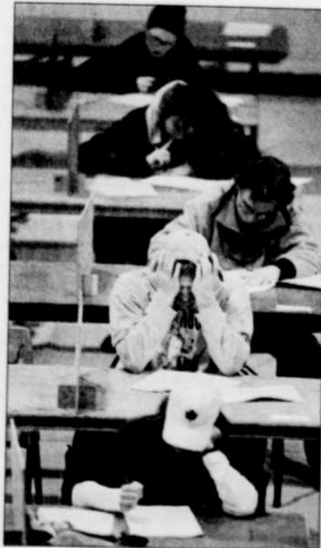
ARCHIVES LE SOLEIL L'argument de la justice sociale ne justifie pas un gel des frais de scolarité.

Ce sont toutes ces considérations qui mènent à croire que le développement de nos universités ne sera pas possible sans un dégel des frais de scolarité. Le Québec, pour des raisons politiques, et avec une approche à courte vue, commet une erreur qui est en train de devenir collectivement coûteuse.