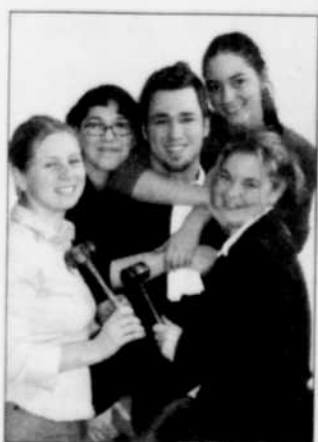
Le Grand Maillet

Les étudiantes et les étudiants de la Faculté de droit, en association avec le cabinet juridique Ogilvy Renault, présentent la revue de variétés Le Grand Maillet , le 28 mars, à 20 h, au Théâtre de la Cité universitaire. Lors de cette soirée, inspirée par l'univers du «Moulin rouge», les multiples talents artistiques d'une cinquantaine d'étudiantes et d'étudiants seront mis en relief par des numéros tous plus divertissants les uns que les autres: musique, chant, danse, humour. Pour recréer l'ambiance de Montmartre à cette époque, cinq étudiantes ont préparé pour l'occasion, des numéros de french cancan. De plus, dix «Maillets» honorifiques seront remis à des étudiantes et des étudiants en signe de reconnaissance pour leur participation et leur engagement au sein de la Faculté de droit. Les billets sont en prévente au coût de 8 $ au Service des activités socioculturelles, local 2344, pavillon Alphonse-Desjardins et au local 0107, pavillon Charles-De Koninck (10 $ à l'entrée). Il est aussi possible de réserver des billets par téléphone, au 802-2831.