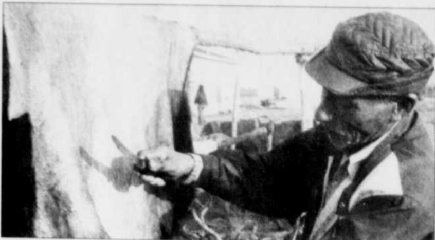
L'ethnologie se situe au carrefour de nombreuses disciplines, dont l'anthropologie. Ici, dépeçage d'une peau de caribou par un Montagnais de la Côte-Nord. La scène est tirée du film Le goût de la farine , réalisé par Pierre Perrault en 1977.