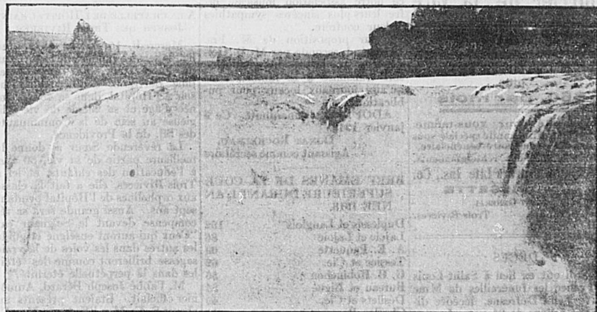
Grand Falls, Nouveau-Brunswick

PAR H. P. TIMMERMAN, COMMISSAIRE INDUSTRIEL AU PACIFIQUE CANADIEN