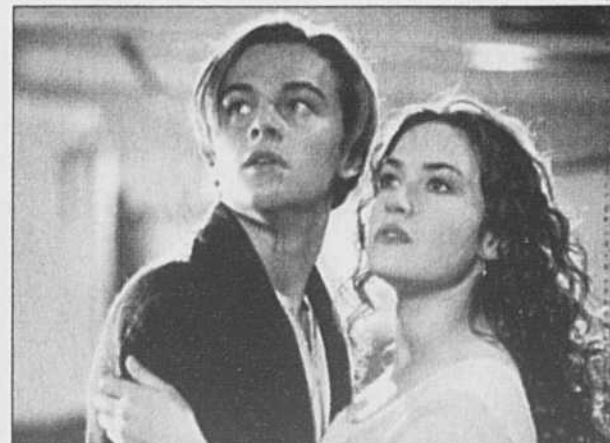
L'un des plus célèbres couples du cinéma, déjà: Jack (Leonardo Di Caprio) et Rose (Kate Winslet).